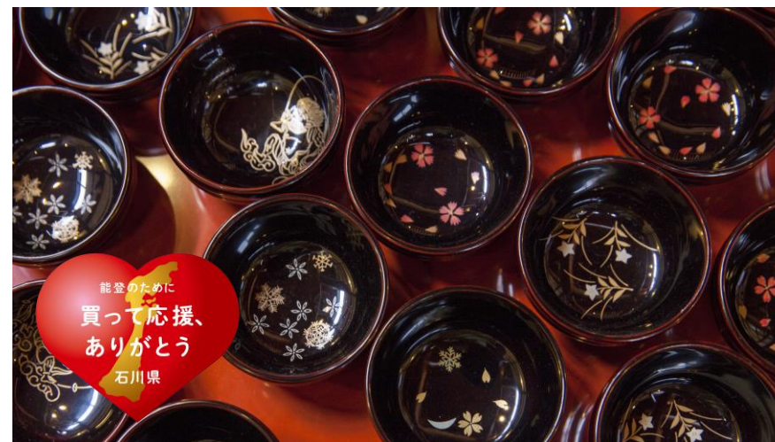
「買って応援、ありがとう」