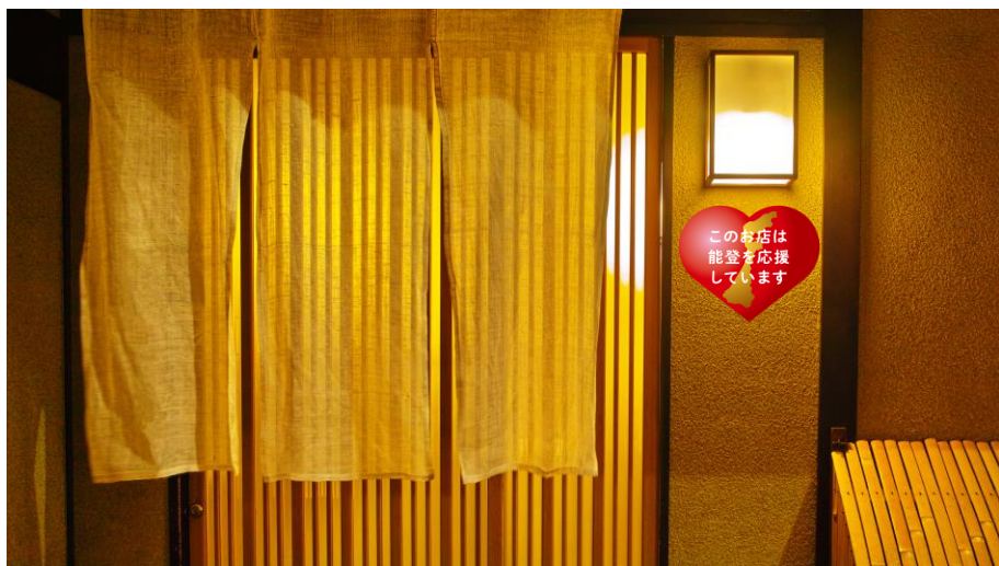
「このお店は能登を応援しています」