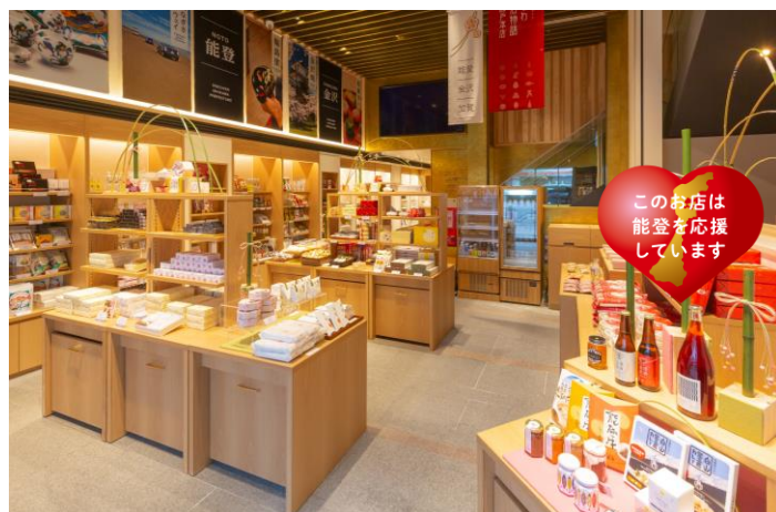
「このお店は能登を 応援しています」