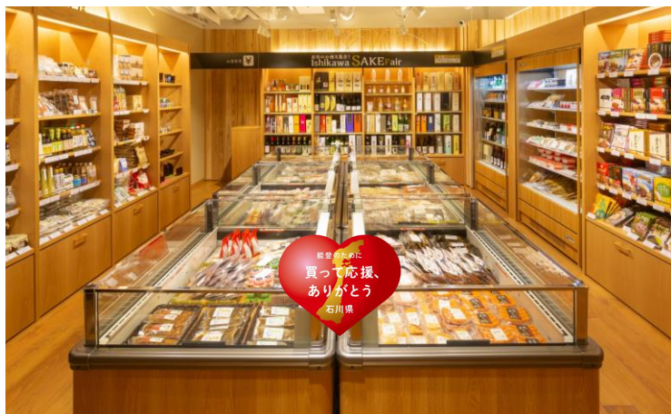
「買って応援、ありがとう」