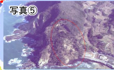
国道249号トンネル坑口崩落