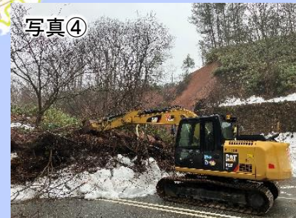
1月3日時点の作業状況 (珠洲道路)