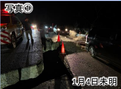
1月4日未明 作業中(主)七尾輪島線