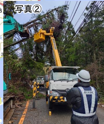
電線にかかる倒木が発生 (作業完了)