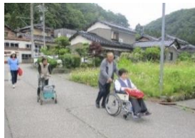
避難訓練実施状況（小松市）