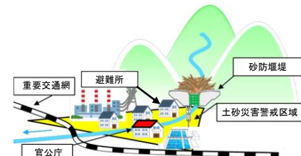
避難所等に対するハード整備（イメージ）