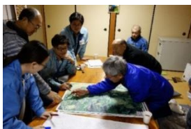
防災マップ作成状況（金沢市）