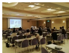
ケアマネジャーへの土砂災害に関する説明の様子

県市町 要配慮者利用施設に対する避難確保計画ガイドライン・避難訓練シナリオの作成・配布