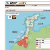
SABO AI (PC版)