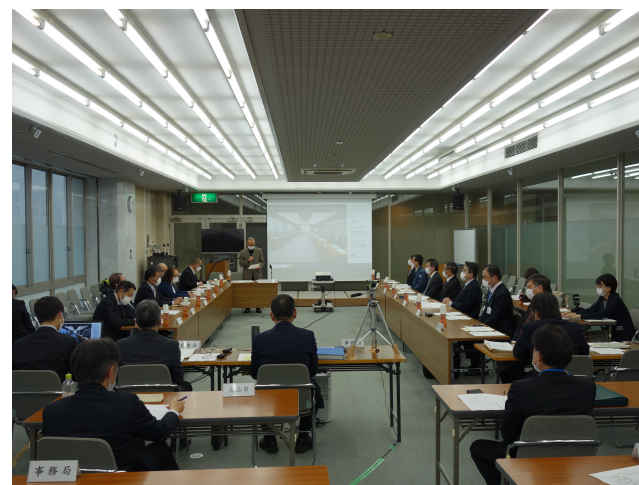
第13回土砂災害対策連絡会

地域毎に抱えるさまざまな課題について、広く市町や住民の意見を聞き、ニーズをくみとる（5土木総合事務所単位で実施）