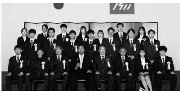
<青少年技能者知事表彰及び越馬技能奨励賞>