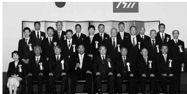
<技能顕功賞知事表彰>