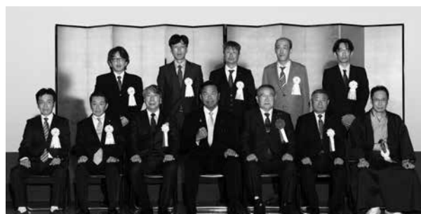
<職業能力開発協会長表彰(技能検定功労者)>