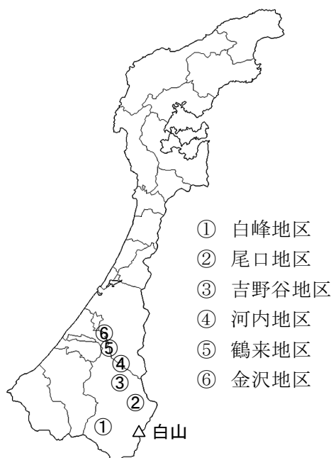
図-1. 調査地区の位置図

そこで、この研究では冷温帯地域に発生したナラ枯れ跡地の樹種構成から林分を類型化すると同時に、稚樹の生育状況と更新条件の解析から跡地の植生推移について考察した。