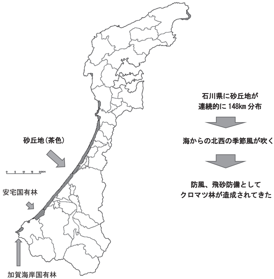
図-1 石川県に分布する砂丘地