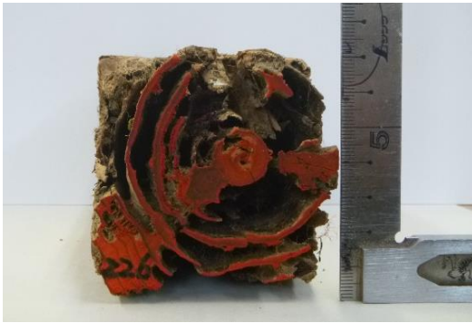
写真-1 シロアリによる地際部の食害状況

2018年に調査したNZN処理試験体のうち4体は地際部がシロアリにより激しく食害されており、62~79%の断面欠損が認められた(写真-1)。