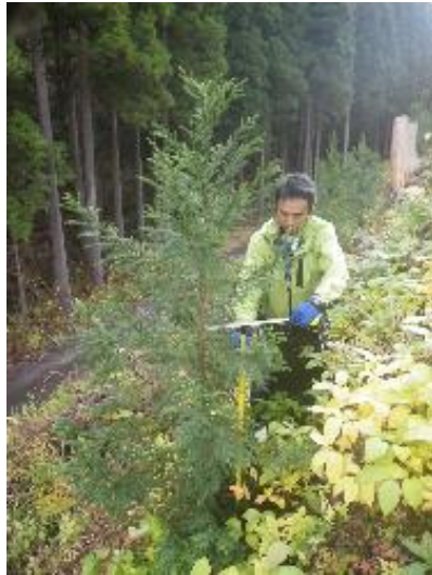
グラップル+コンテナ普通苗 +植栽機