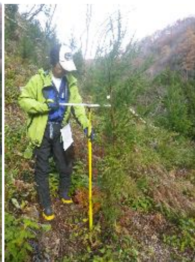
コンテナ大苗+植栽機