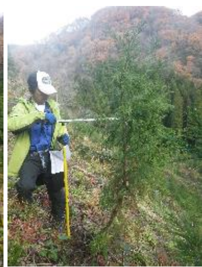
コンテナ大苗+クワ