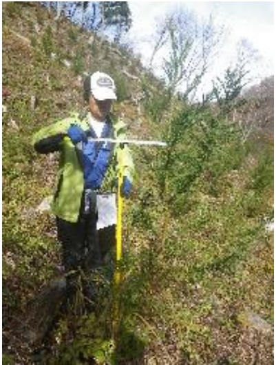
コンテナ普通苗+植栽機