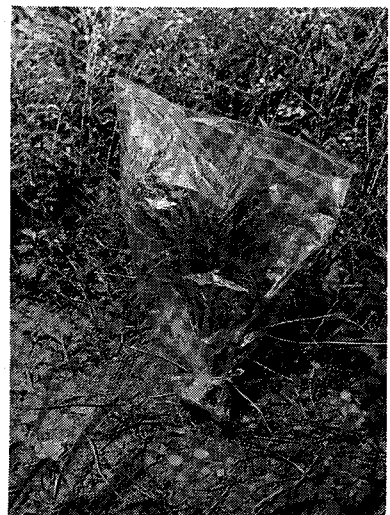
ナイロン袋かぶせ法

新聞紙巻き法では、労力的に従来のワラヅト法より幾分有利であるが、風を強くうけるために、根が動いたり切れたりして枯死するものがあり、また融雪