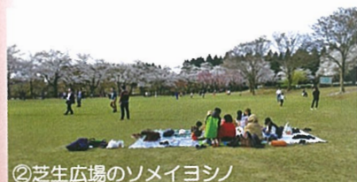
②芝生広場のソメイヨシノ