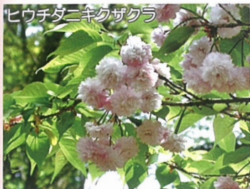
ヒウチダニキクザクラ

サクラは約130品種、約900本が植えられています。見頃は4月上旬から下旬と長く花見を楽しむことができます。