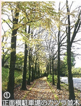
①正面横駐車場のカツラ並木