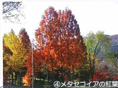
④メタセコイアの紅葉

林業試験場・樹木公園のホームページはこちら http://www.pref.ishikawa.lg.jp/ringyo/index.html