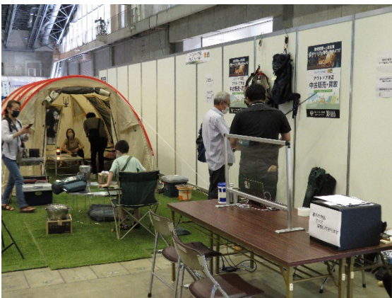
キャンプ用品の展示・使用体験