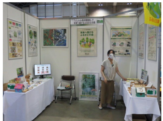
県産材を使用した木製品を展示

森林環境税による森林整備の取組や県産材の利活用を通じた森林の多面的機能の重要性について紹介。