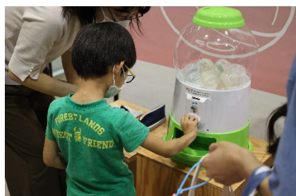
ガチャガチャを回す子ども

「ミライ地球ガチャ」は、ガチャガチャを回して出てきた「将来発生しうる気候変動による影響」に対して、来場者にそれらへの「適応策」を自由に回答してもらい、「適応」について知るきっかけを得てもらうという、子ども向けの体験ブースです。