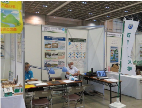
シミュレーション体験