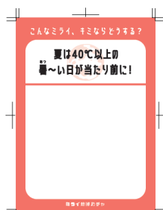
質問&回答用紙（一例）