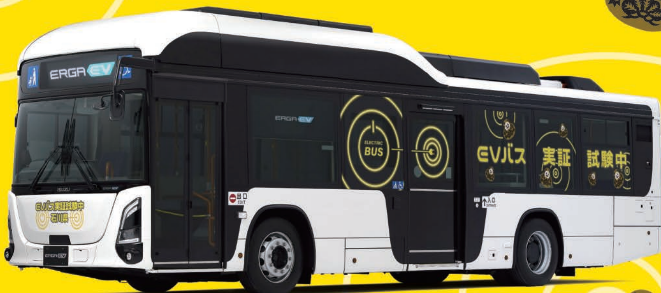
運行車両/いすゞ製 EVバス「ERGA EV(エルガEV)」