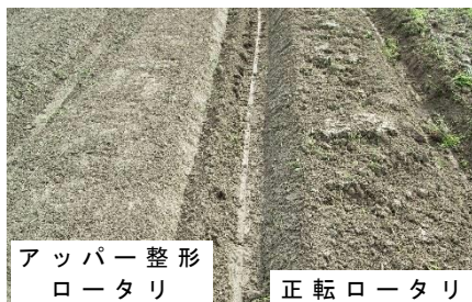
写真 畝立て直後の様子