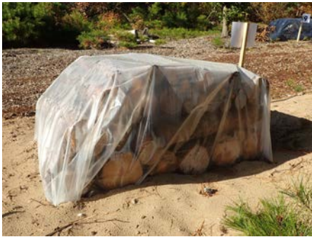
写真1 上面被覆式（かぶせ式）

防災林として重要な海岸松林においては、未だに松くい虫被害により集団的な枯損が発生している。被害のまん延を防止するため、被害木を伐倒後、集積、ビニルシートで被覆、殺虫剤でくん蒸（伐倒くん蒸処理）を行い、防除を実施している。同手法には、シートを上から被せて被覆する「上面被覆式」（通称「かぶせ式」、写真1）と被害木全体を包み込む「全面被覆式」（通称「あめ玉式」、写真2）がある。本研究では両方式の作業効率や駆除効果を比較・検討する。