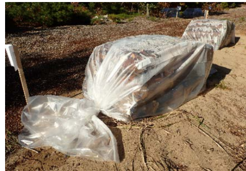
写真2 全面被覆式（あめ玉式）