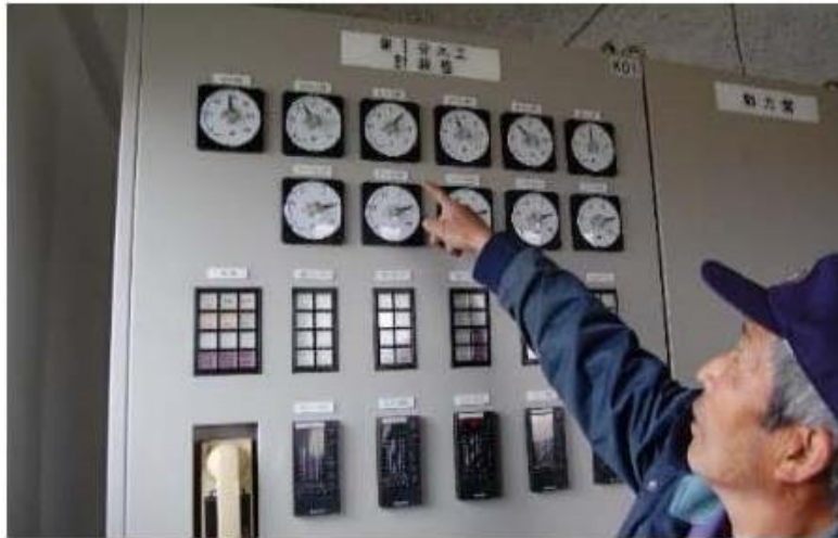
ポンプの運転状況