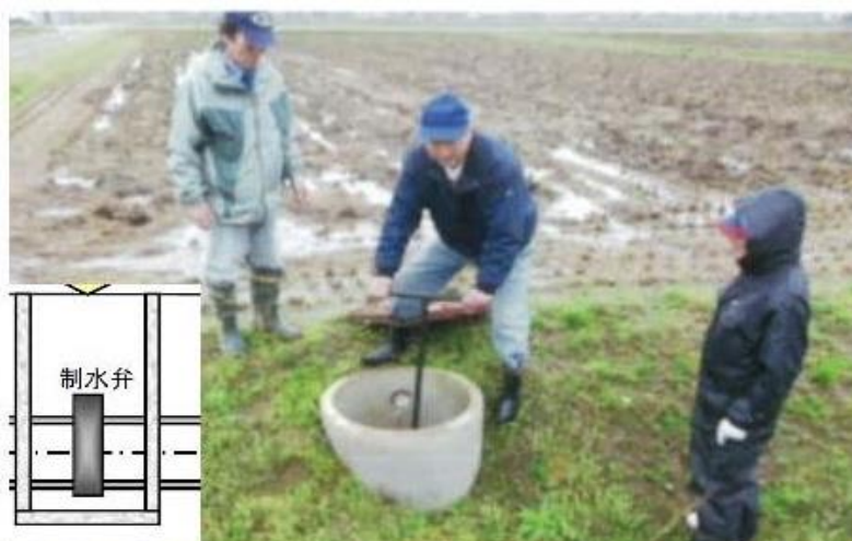
弁の動作確認状況