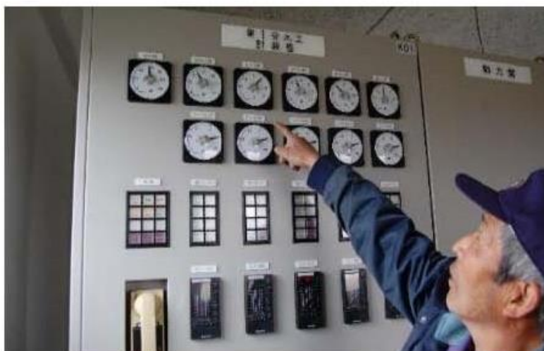
ポンプの運転状況