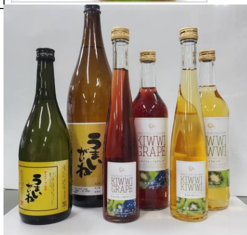
キウイワイン、ヤーコン焼酎

農業祭を通じ、「食」と「農」への理解の促進を図り、農業者と地域の方々とのふれあう場の提供を行っています。