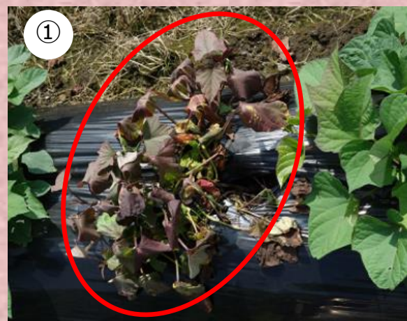
発生初期(葉の変色)