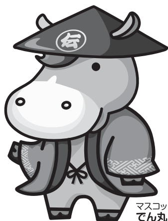
マスコットキャラクター でん丸くん