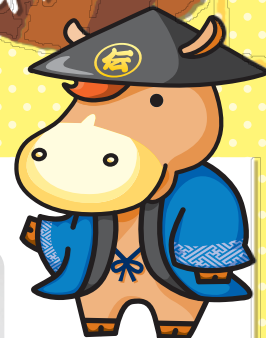
マスコットキャラクター でん丸くん