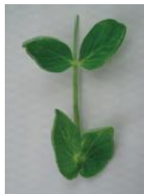
明らかにカップ状 =1