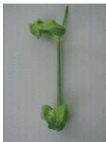
ひどく変形し原型をとどめない =3