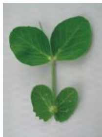
わずかにカップ状 =0.5