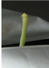
展葉なし（芯止まり） =4