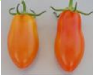
品目: ミニトマト 症状: 果実が細長く変形