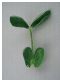
カップ状からさらに変形 =2