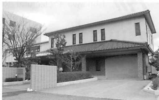
ほっとあんしんの家

今回のリニューアルでは最新の評価設備や福祉用具を数多く揃え、その人に最適な生活環境や、車椅子、コミュニケーション及び上肢作業動作等に必要な生活機能が確認できます。障害のある方々や多くの専門職の方に体験を通じた相談や支援の場として、ご利用頂ければと思います。また、医療福祉関係者の技術研修や企業の研究開発等を行う場としても利用できます。