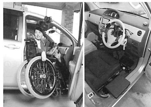
運転評価用自動車

人間の歩行などの動作を高速度カメラ、コンピュータを使って解析する「リアルタイム三次元動作解析システム」、筋や関節の障害の診断に役立つ「超音波診断装置」、空気圧を利用して体重を免荷し、麻痺や筋力低下がある患者さんでも早期歩行訓練ができる「反重力トレッドミル」等、最新のリハビリテーション機器を整備し、より効果的なリハビリテーションプログラムが提供できます。