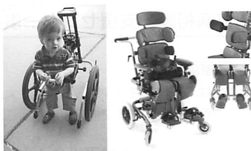
座位保持・歩行支援装置

四肢麻痺等で座ることや歩行が困難な方に対し、胸部、腰部、下肢等のサポート部品を細かく調整できる座位保持・歩行支援装置を導入。障害の度合いや成長に合わせて細かく調整でき、試用を通して本人に最適な用具を探せます。