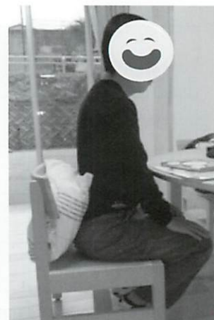
クッションを入れることにより骨盤が前傾し背中が伸びる