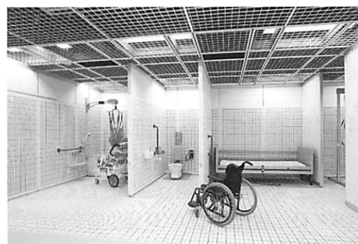
間取り・設備配置測定装置

2.5センチ間隔で穴を開けた移動壁により、部屋のスペース、浴槽、便器、手すり等の位置を自由に変えて動作評価ができる設備を導入。模擬体験を通して、本人に最適な浴室やトイレの設計、住宅改修を支援できます。