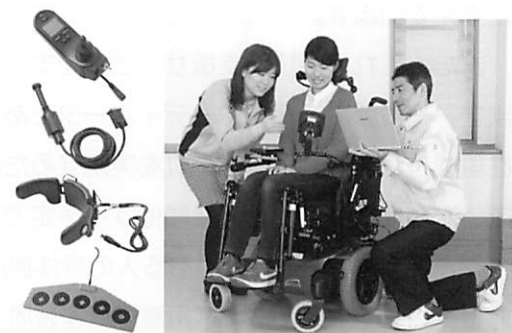
電動車椅子測定装置

目の動きで思いの表現やテレビ、エアコンの操作ができるなど、飛躍的に進化した情報技術を活用した意思伝達装置を導入。また、スマートフォンやタブレット端末を使い、家族が外出先から自宅の様子を確認できる見守り・コミュニケーションシステムやロボットなども体験できます。