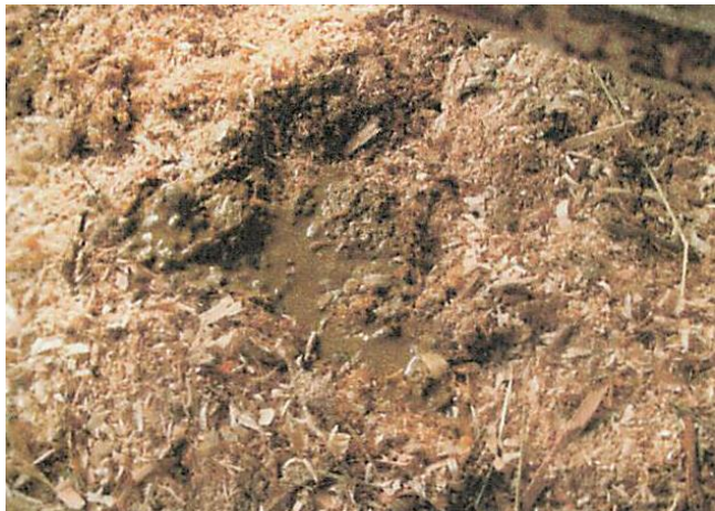
黄色っぽい水様便 細菌・ウイルス類の感染が疑われます。獣医師の診断を受けましょう。