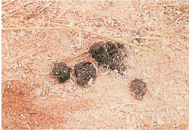
コロんとした固形の便 脱水症状、発熱の可能性があります。