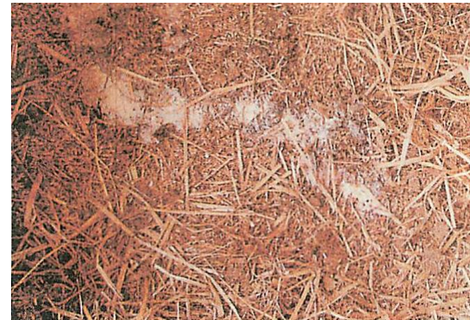
白い水様便 消化・吸収不良の場合と、細菌・ウイルスの感染が疑われます。