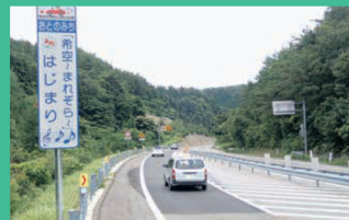
おとのみちを車が通ると、メロディーが聞こえます。