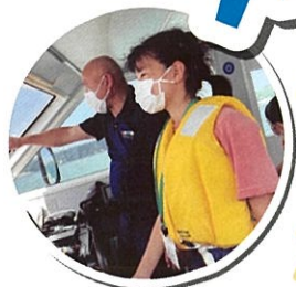
「おおとり丸」で船の操舵体験♪