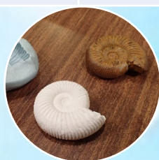
アンモナイトのレプリカ