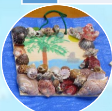
石と貝のかべかざり