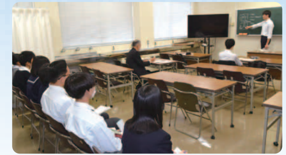
大学生が行う模擬授業を熱心に参観する高校生

いしかわ師範塾では教員を目指す大学3年生等を対象に模擬授業等の実践的な研修を行っており、高校生向けのオープンスクールは6年ぶりの実施です。参加した高校生は、体験講座「学校の先生になろう」を受講した後、模擬授業を参観し、大学生が指導員からアドバイスを受けながら授業づくりに取り組む様子を、真剣な表情で見つめていました。