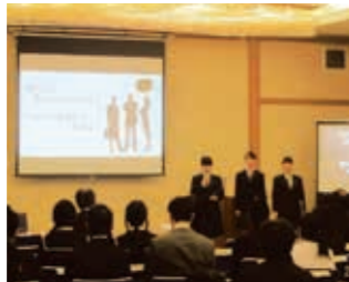
意見・体験発表(5日)