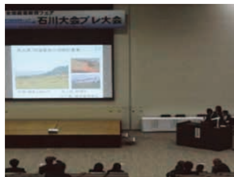
世界農業遺産シンポジウム(5日) —全国高校生里山里海サミット— 石川、新潟、静岡、岐阜、和歌山、大分、熊本、宮崎の各県の高校生が参加

開閉会式典、世界農業遺産シンポジウム、記念講演、作品展示(全国・県内専門部・義務教育部)、各種体験コーナー、作品・研究発表、特別支援学校喫茶コーナー、専門学校コーナー、交流イベント(生徒実行委員会、各部会発表・紹介)