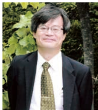
記念講演(5日) 講師 名古屋大学教授 天野 浩氏 ノーベル物理学賞受賞(2014年)