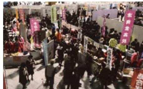
全国高校デパート

石川の産業・企業・大学ブース、国際交流ブース、展示販売コーナー、交流イベント(手話によるパフォーマンス、和太鼓演奏、吹奏楽他)、コンテスト