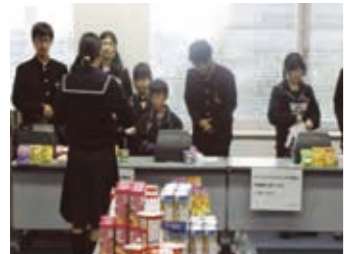
キッズビジネスタウン