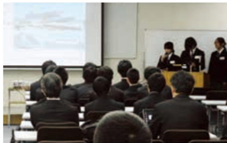
全国高校生ビジネス英語コンテスト(6日)