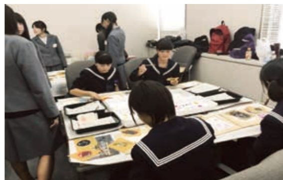
各種体験コーナー ものづくり体験、健康チェック、マッサージ他