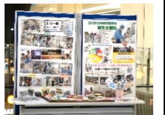
専門部会紹介パネル

開催1ヶ月前より各校紹介パネルの展示を行い、地元住民の関心を高める。また、いしかわ産業教育フェア2024のパネルも展示。