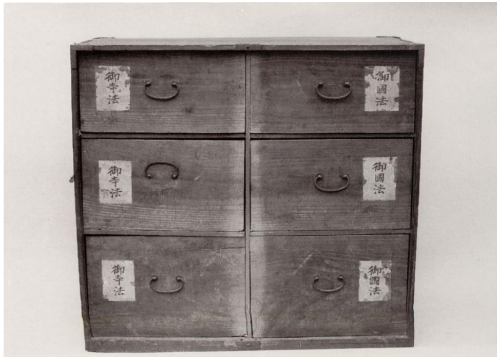
文書が保管されていた筆筒