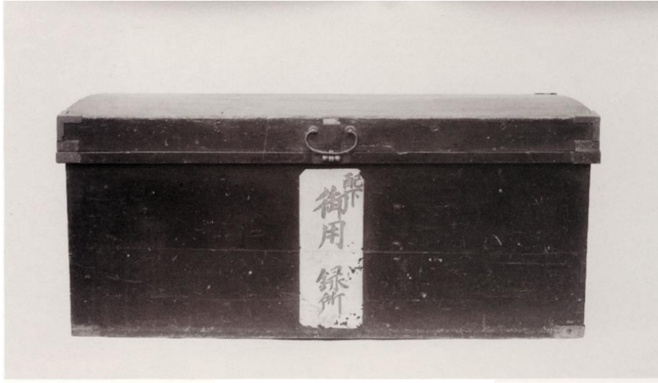
文書が保管されていた長持