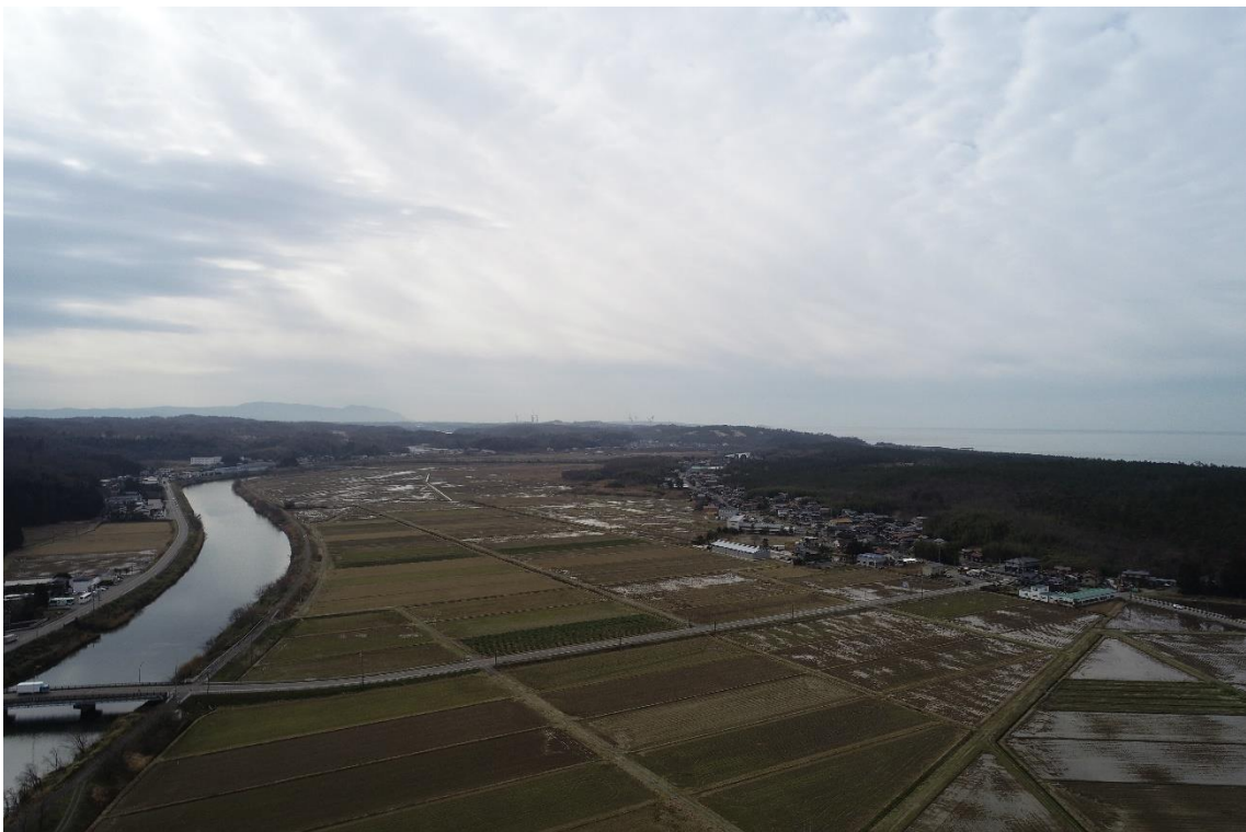
砂防林・集落・水田・河川（北東から）