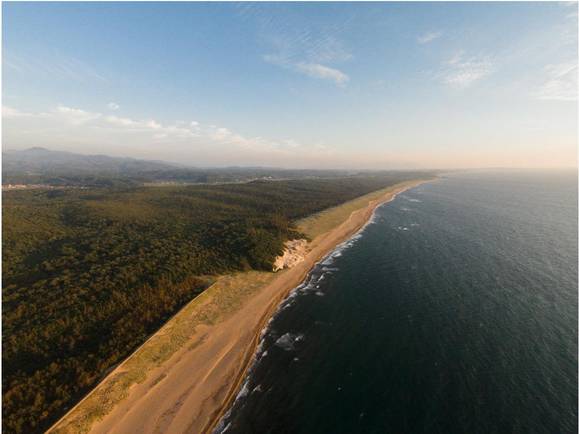
海浜・砂防林（北東から）