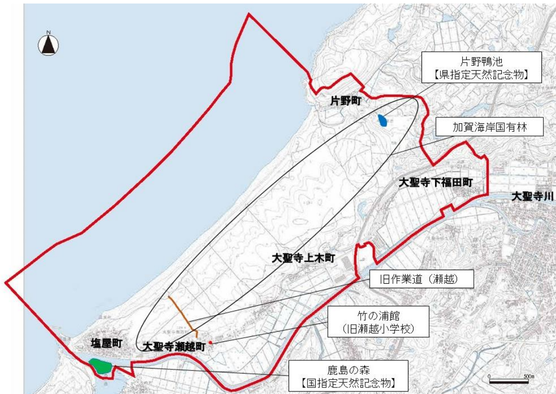
重要な構成要素 (主なもの)