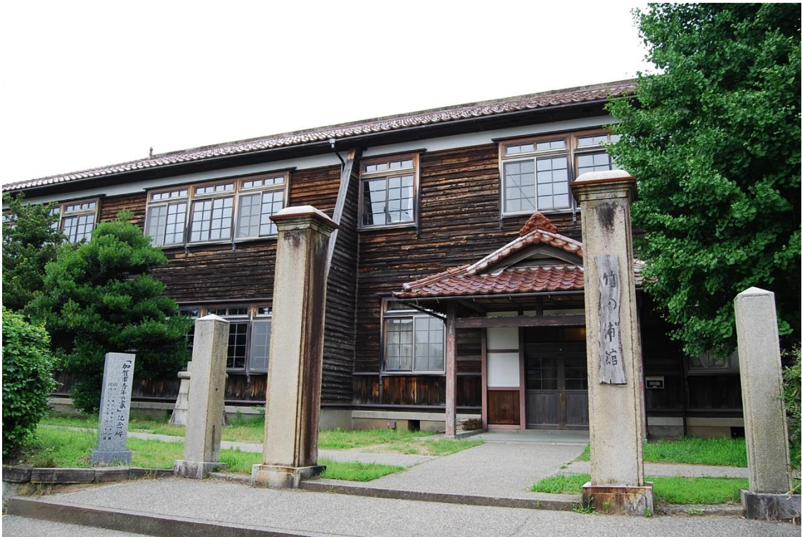
竹の浦館（旧瀬越小学校）