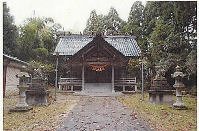
そうじゃほんでん 総社本殿