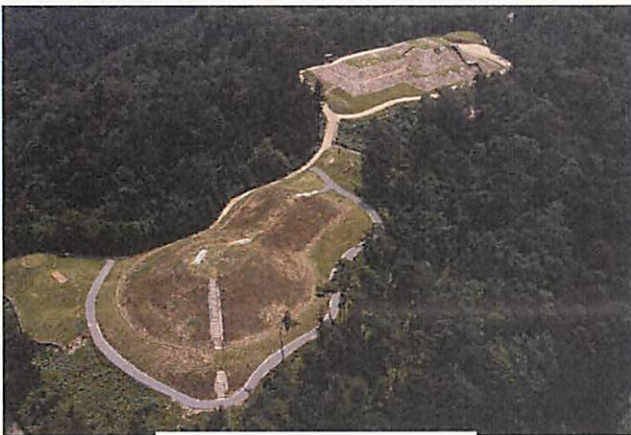
あめ みやこふんぐん 雨の宮古墳群

能登では、4世紀後半から水陸の要所に「能登の王墓」というにふさわしい規模の古墳が築かれてきた。「能登の王墓」は時代を経て、墳丘上に社が建ち、地域の人々が祈りを捧げる場所へと変容しながらも継承され、様々な文化や伝承を生み出し、今も引き継がれている。