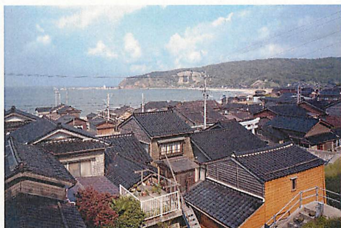
くろしまでんとうてきけんぞうぶつぐんほぞんちく 黒島伝統的建造物群保存地区