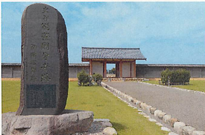
のこくぶんじあと 能登国分寺跡