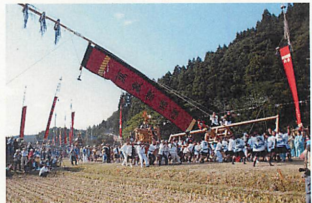
くまかぶわはつかまつりわくばたぎょうじ 熊甲二十日祭の杵旗行事