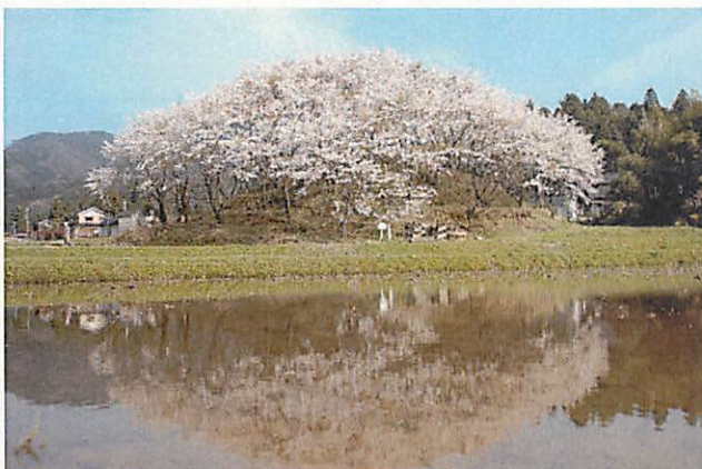
みじろなべやまこふん 水白鍋山古墳