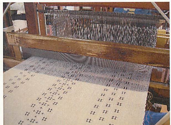
の と じょう ぶ 能登上布