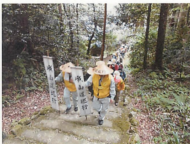
がさんどう 峨山道