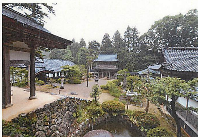
ようこうじ 永光寺