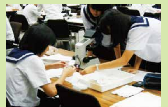
実技競技(実験系)に取り組む高校生

10月26日(日) 実技競技 (会場:石川県地場産業振興センター) 11月上旬 筆記競技(会場:各参加校)