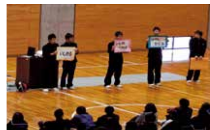
◎児童会・生徒会が主体的に取り組むいじめの未然防止の取組を推進します。

子どもの様子に 変わりはありますか？ 「あれ？」もしかして 「あれ？」もしかして ご家族だけで悩まずに、 学校へ相談しましょう。