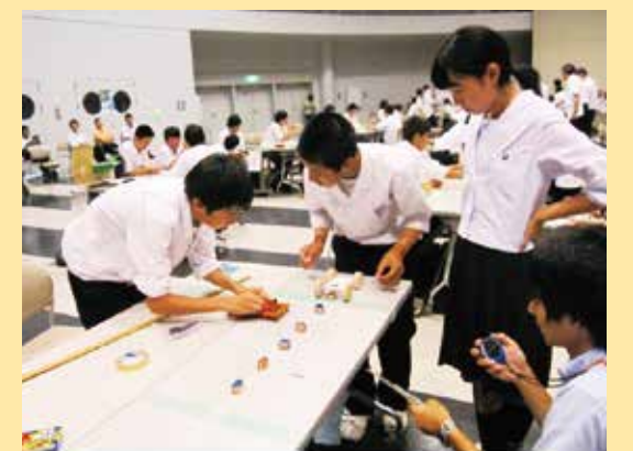
競技に取り組む中学生

志賀会場 8月1日(金) 志賀町文化ホール 能美会場 8月6日(水) 能美市根上総合文化会館 金沢会場 8月7日(木) 金沢市民芸術村 第2回科学の甲子園ジュニア石川県大会 10月上旬