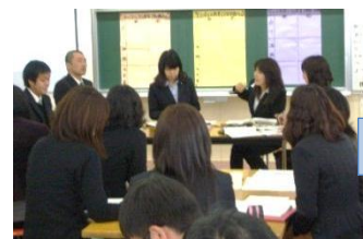
授業整理会の様子

授業の第一声が子どもの声で始まった点や、わくわくする言語活動が単元全体に位置づけられている点など、大変参考となる授業を発信して頂きました。