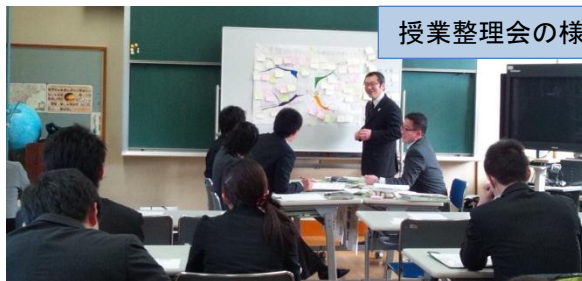
授業整理会の様子

ポイントが図解で示してあったり、「ターン・タ・タン」とリズムに置き換えたりと、随所に工夫が見られる授業を発信して頂きました。