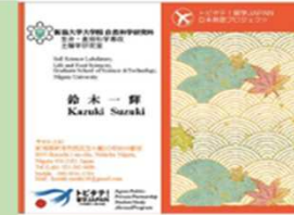
日本らしさを全面に出した名刺