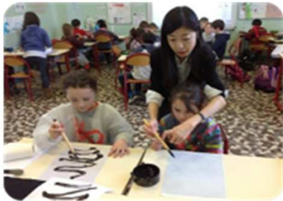
フランスで子ども達に書道教室