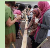
マレーシアで 流しそうめん