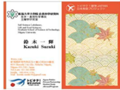
日本らしさを全面に出した名刺