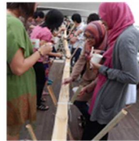
マレーシアで 流しそうめん