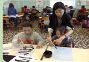
フランスで子ども達に書道教室