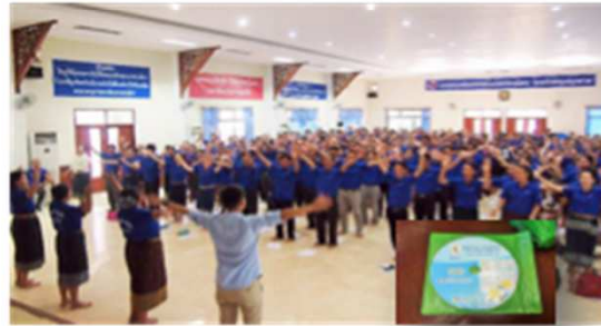
「九九のうた」ラオス語版を作成し、 現地の小学校教員500名に伝授