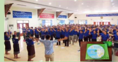
「九九のうた」ラオス語版を作成し、 現地の小学校教員500名に伝授