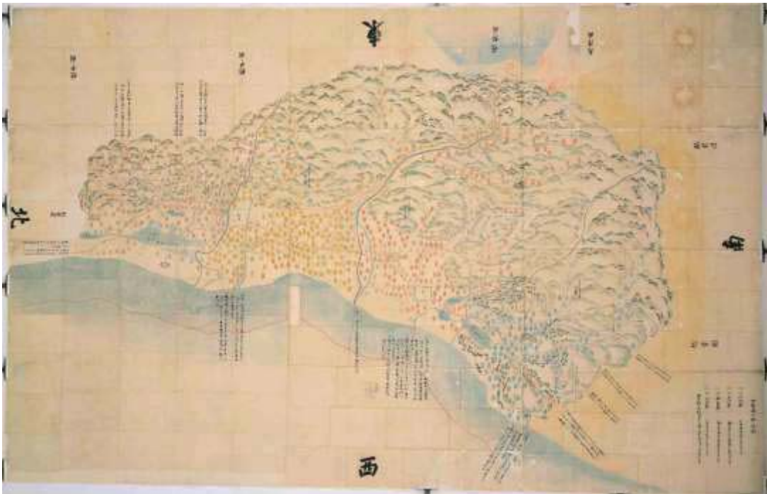
加越能三箇国絵図（加賀）