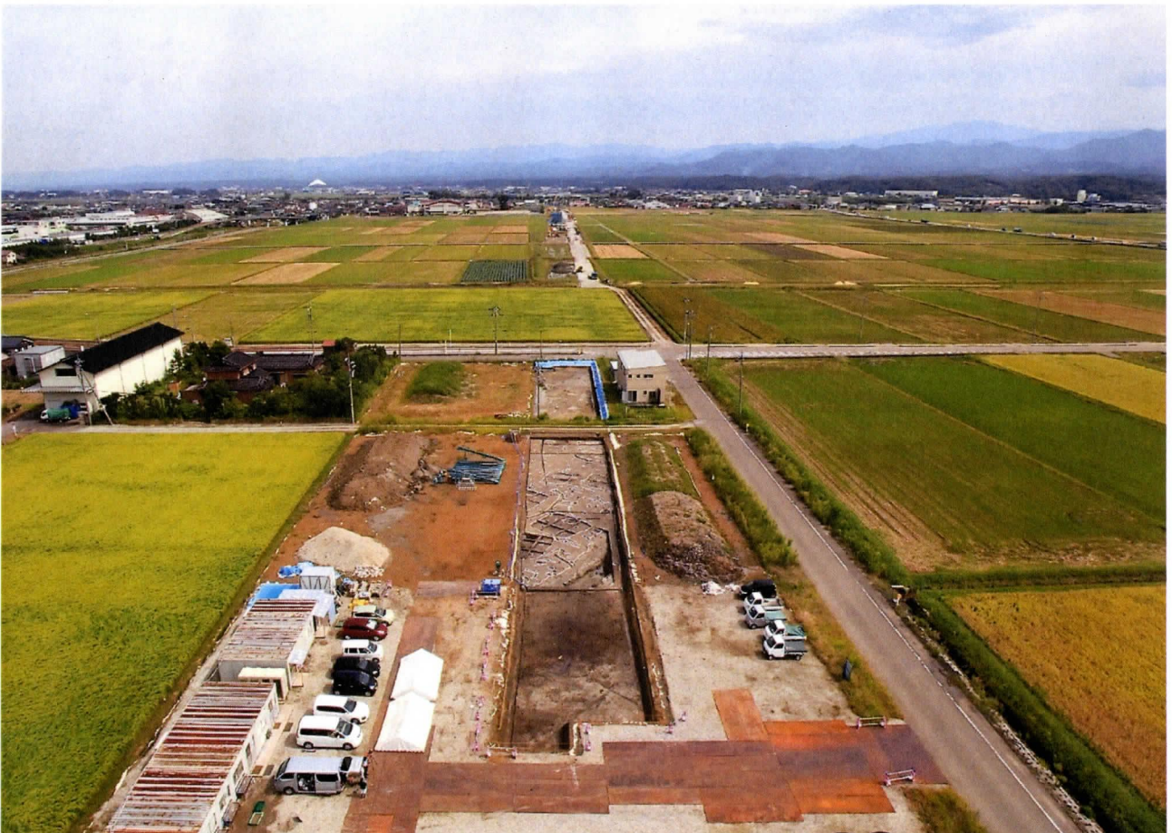
八日市遺跡遠景（西から）