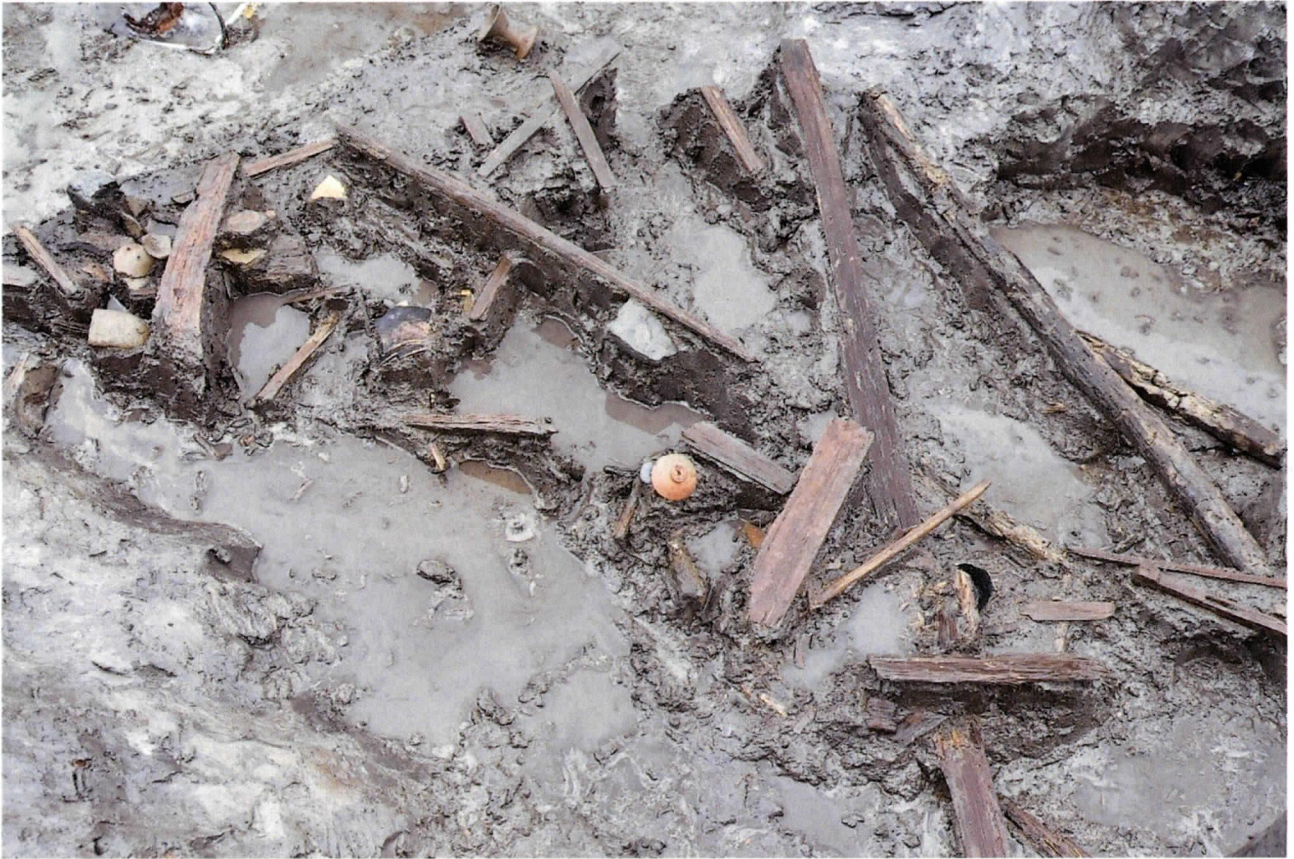
川跡からの遺物出土状況（土器、木製品）