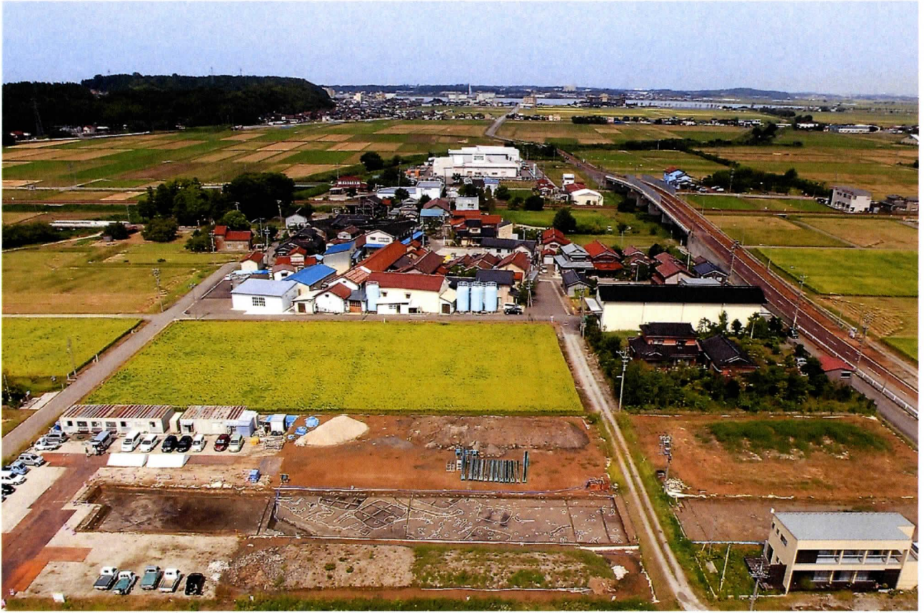
八日市遺跡遠景（南から）