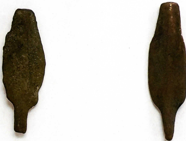
銅鏃の未完成品（左：長さ 3.8 cm、右：同 4.2 cm）