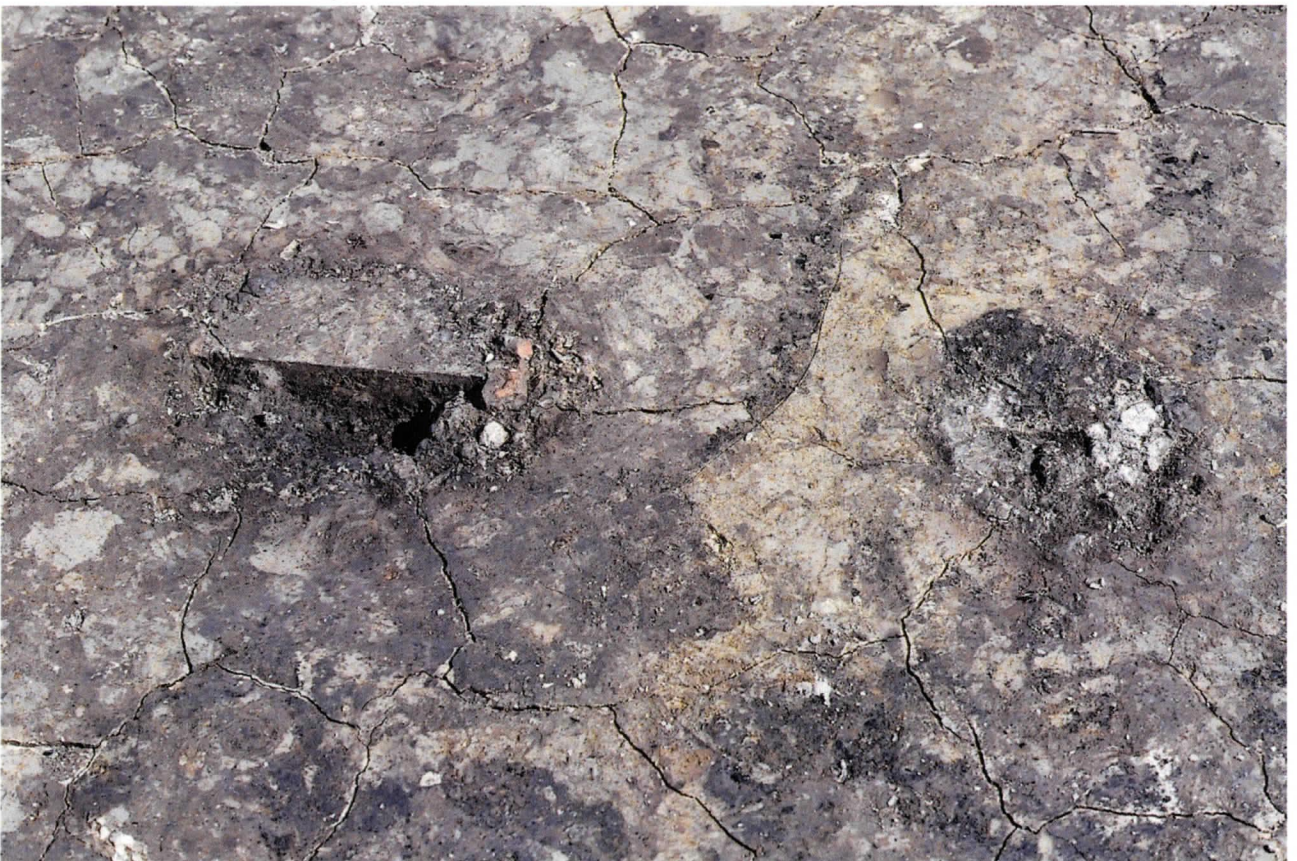
小型の炉跡（1号炉（左）、2号炉（右））