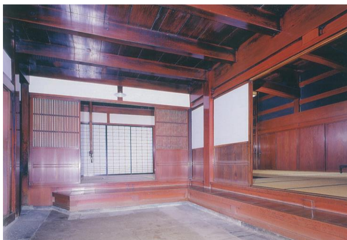
旧酒谷長兵衛家住宅（北前船の里資料館）