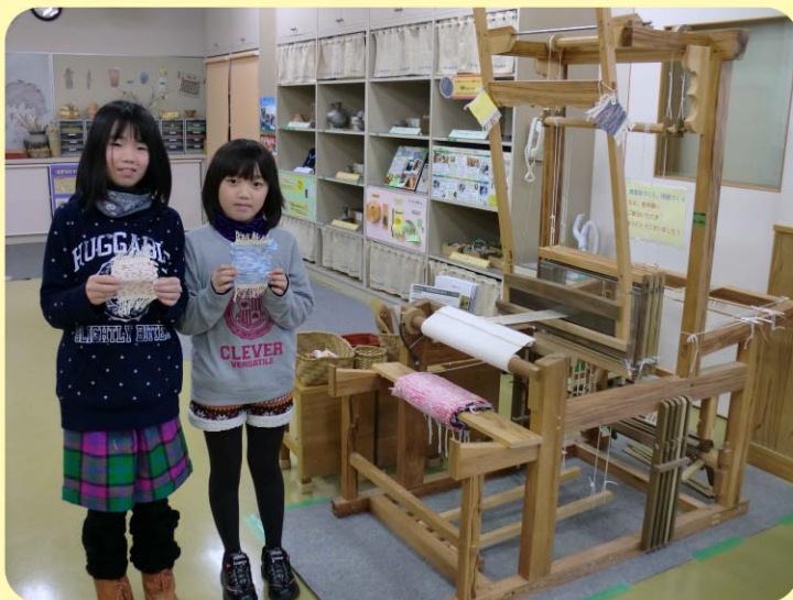
みんなで楽しく、はたおり体験

古代から使われている“ たかはた 高機”を使用して、織物 (幅 10cm、長さ 10cmほど) を製作します。