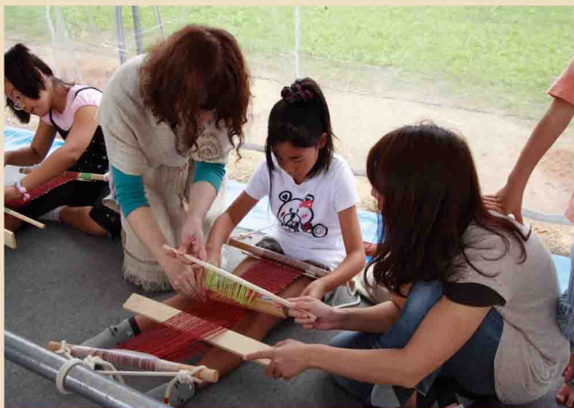
原始機にチャレンジ!

弥生時代から使われている機織具(原始機)で織物を製作し、布を織る技術を学びます。作品は当日お持ち帰りいただけます。