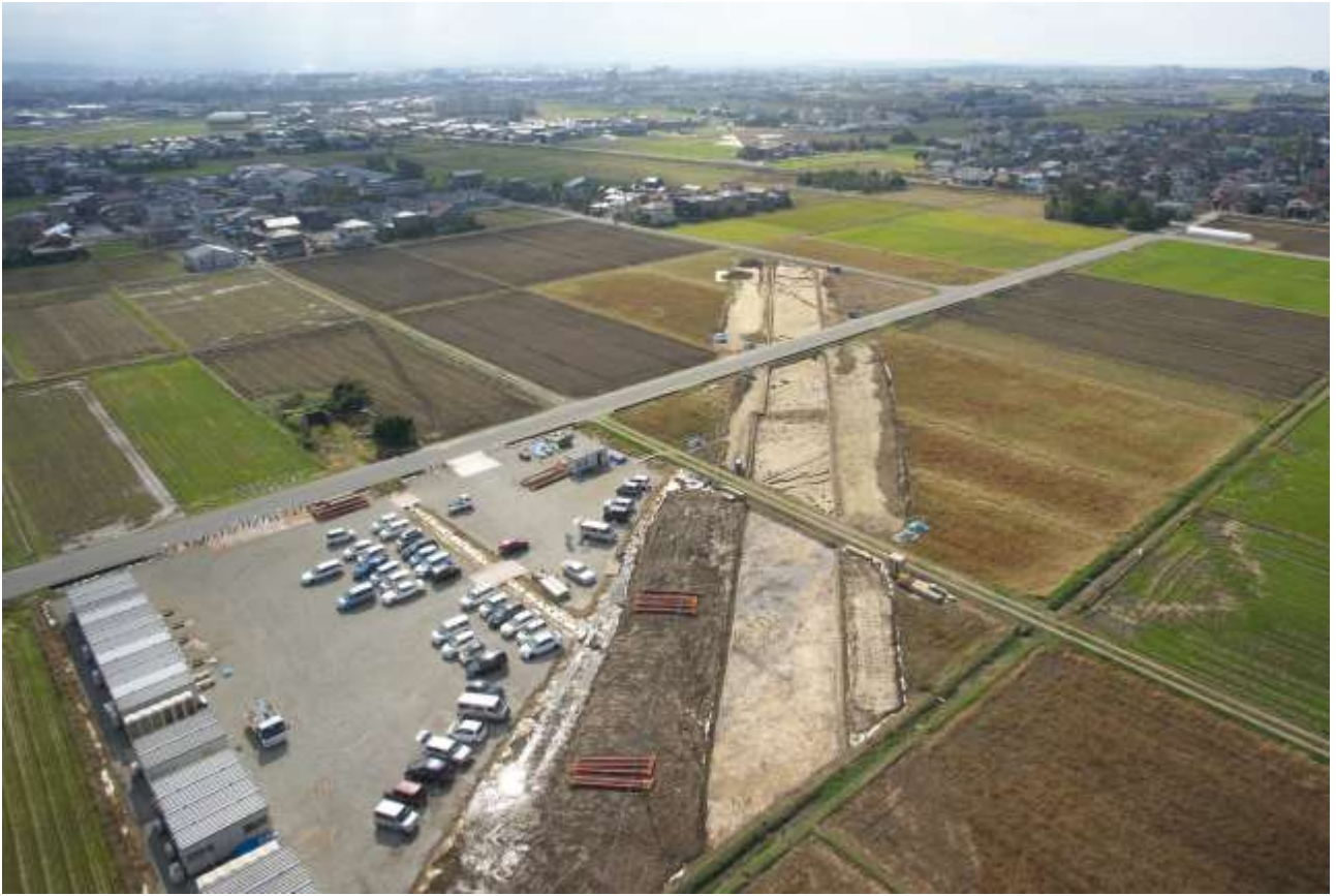
中ノ江遺跡調査地遠景（北東から）