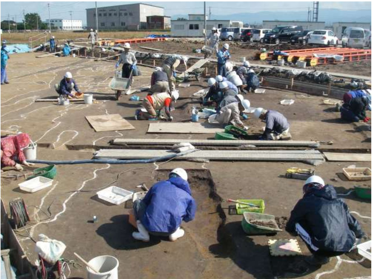
発掘調査作業風景