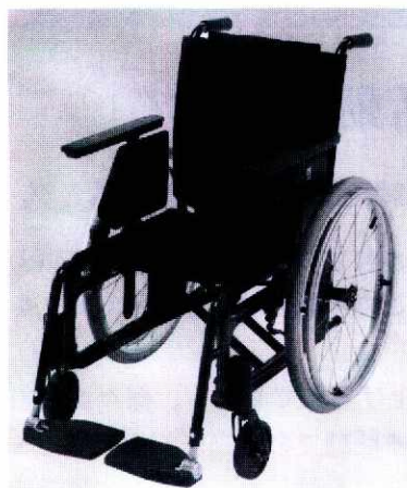
モジュラータイプ車いす

今回は、平成12年4月からスタートした介護保険制度の影響が大きく現れており、福祉用具等の貸与や購入の種目(車いす、特殊寝台、歩行器、移動用リフト等)に対応した新製品や開発品が数多く出展されていました。一つの製品でより多くの人へ対応ができるような部品選択や調整機能、さらに他の製品と差別化を図るための付加機能がアピールされていました。例えば車いすでは、調整機能が付いたモジュラータイプ車いすや座面と背面が一体となって前後に傾くチルト機能付き車いす等がありました。