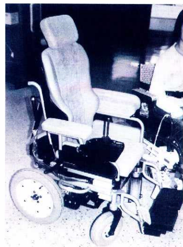
県内企業が製作した座シート