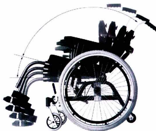
チルト機能付き車いす

その他、注目を集めていた開発品としては、二輪で起立して走行したり、階段を昇降できる電動車いす(米国製)がありました。これは、ジャイロセンサーの働きで常に使用者の姿勢を水平に保ち、通常走行、回転型四輪駆動による段差乗り越え、二輪起立走行、階段昇降といった四つの駆動モードで移動することができるものです。現在、米国の方ではFDA (Food and Drug Administration) の認可を得るための安全性テスト、臨床テストが行われているようです。