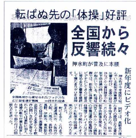
町では昨年度、体操のビデオを通じて家庭での普及を図った。