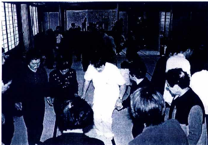
北國新聞 (H13. 3. 19)