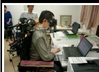
○重度障害者の在宅・就労 支援