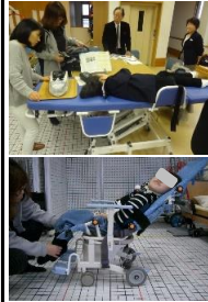
○重度障害生徒の学校生活 支援 (県教委)