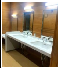
◎三国山キャンプ場 シャワー棟 (営繕課)