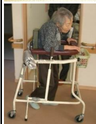
◎転倒予防制動装置付き 歩行車の開発支援 (メディベック)