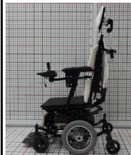
◎電動ティルト・リクライニング 簡易電動車椅子(今仙技研)