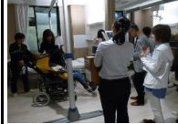
◎県立中央病院 (営繕課)