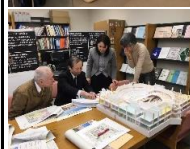
◎金沢港クルーズターミナル (営繕課)