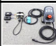
●電動車椅子操作装置研究 (今仙技研)