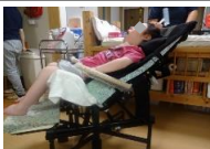
○座位保持装置 (まる工房)