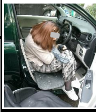
○自動車運転支援 (ケアカーズ)