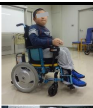
○重度障害児の住宅生活支援