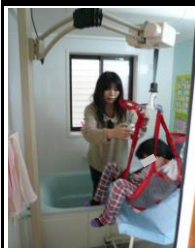
○障害児入浴リフト設置 (トミクライフケア)