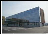
◎県央土木事務所 (営繕課)