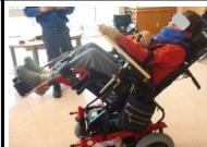
○重度障害者の電動車椅子