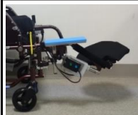
●電動昇降式フット・レグサポート サポート (今仙技研)