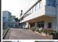
◎医王特別支援学校 (営繕課)