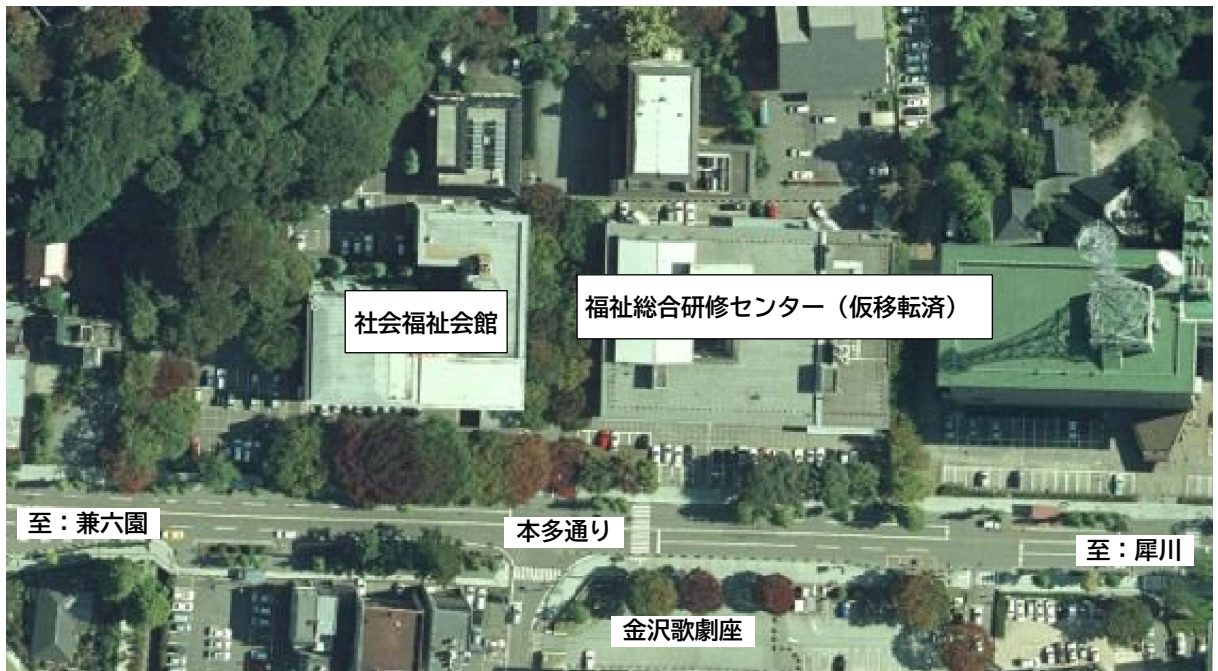
【現社会福社会館の敷地内の配置状況】