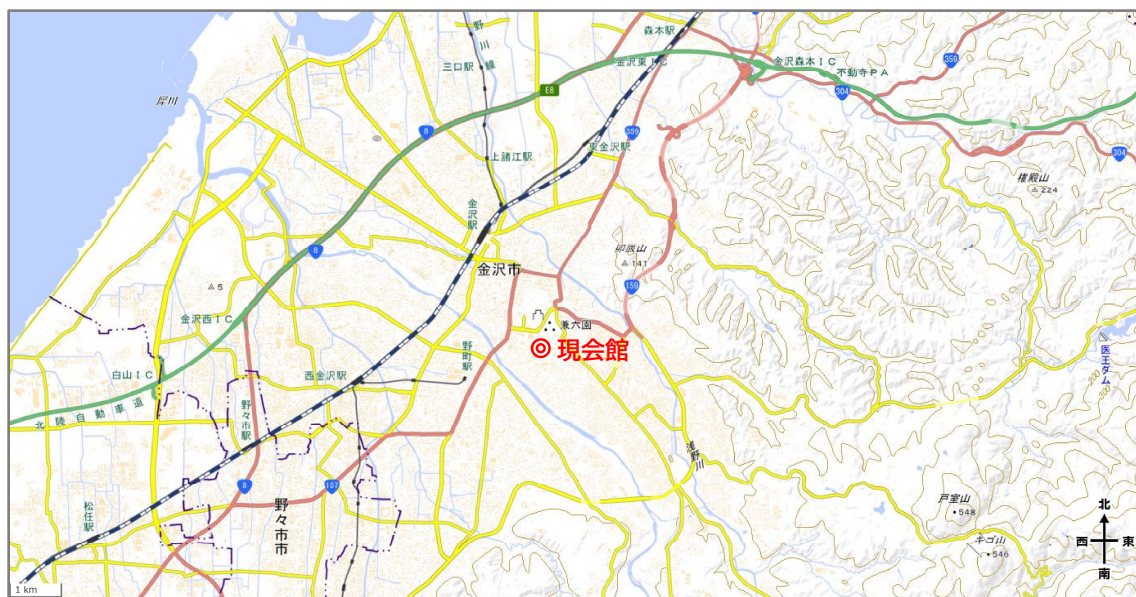
【現社会福祉会館の位置】