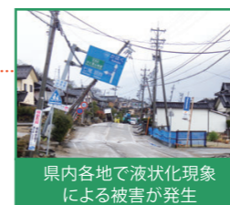
県内各地で液状化現象による被害が発生