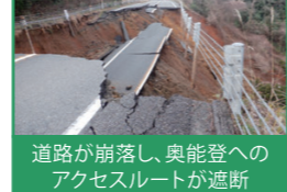
道路が崩落し、奥能登へのアクセスルートが遮断 県が管理する道路では最大42路線87カ所で通行止め(1月4日時点)