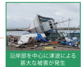
沿岸部を中心に津波による甚大な被害が発生