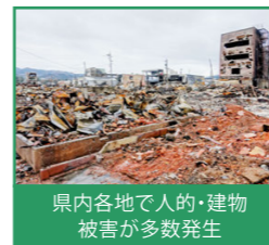
県内各地で人的・建物被害が多数発生