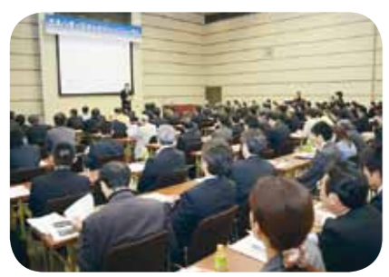
省エネに関する普及・啓発セミナーを開催し、企 業のエコ意識を高めます

省エネ版企業ドックでは、エ ネルギー管理士と中小企業診断 士を企業に派遣し、光熱費の削 減や設備投資、省エネによる経 営改善策などを提案。平成23年 度にスタートし、これまでに 145社の県内企業が診断を受 け、省エネ・経営改善それぞれ