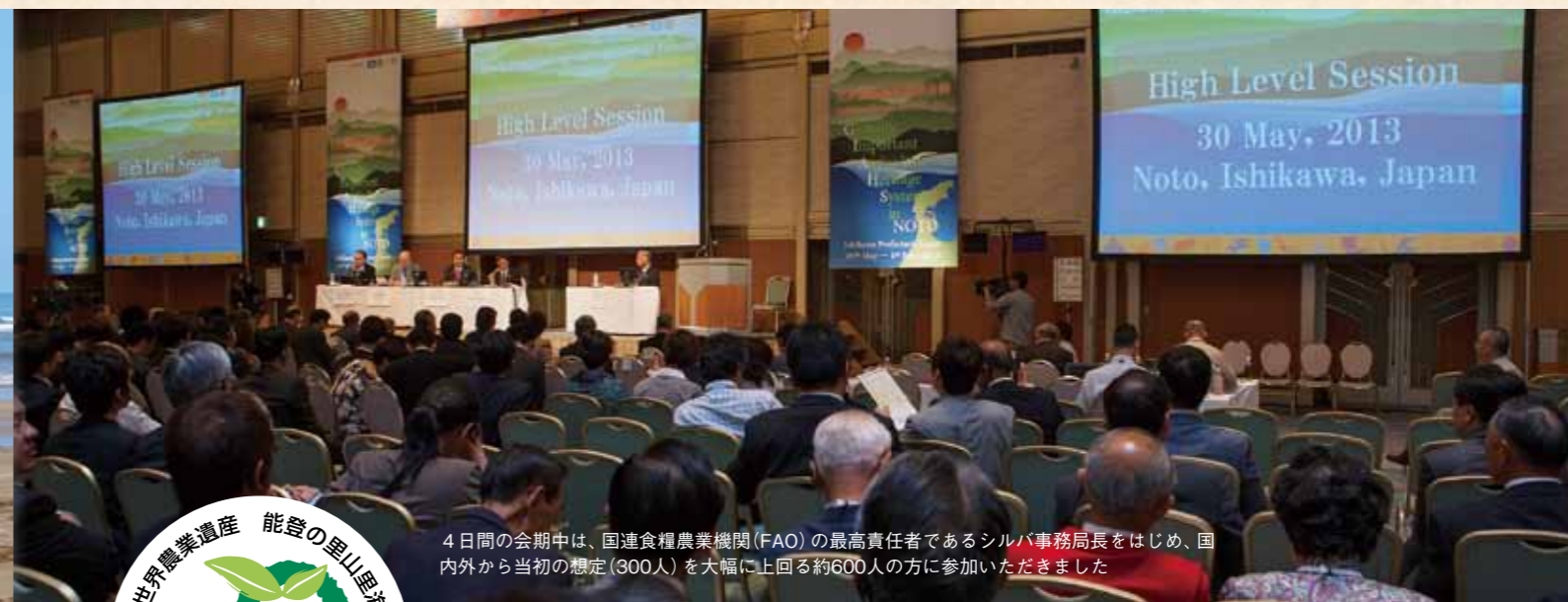
4日間の会期中は、国連食糧農業機関(FAO)の最高責任者であるシルバ事務局長をはじめ、国内外から当初の想定(300人)を大幅に上回る約600人の方に参加いただきました。