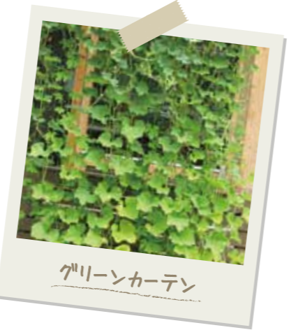
グリーンカーテン

1階リビングの窓の外には、ゴーヤなどを植えてグリーンカーテンを設置。直射日光を遮り、室内の温度上昇を防ぎます。さらに、グリーンカーテンは、見た目も涼しく、収穫したゴーヤはおいしく食べられるとあって、一石三鳥のエコアイデアです。