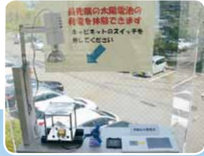
最先端の太陽光発電を体験できるコーナーもあります

ゾーン内には、ビル内の電力制御を一元化するビルエネルギーマネジメントシステム(BEMS)や太陽光パネル、遮熱ガラス、LED照明など、さまざまな最新機器を導入。地場産業振興センターや工業試験場(財)石川県産業創出支援機構(財)ISICO)、経済関係団体が集積する産業振興ゾーンを訪れた企業の方々に、これらの機器も併せて見学していただくことで、省エネ効果の大きさを実感してもらいたいと考えています。