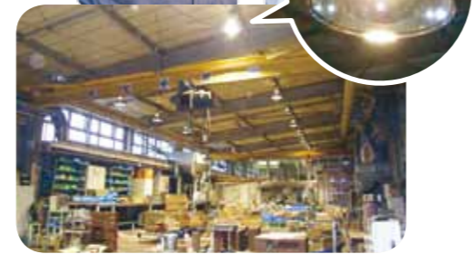
効率に優れたランプと反射笠に取り換えるなどの省エ ネ化を進め、自社の競争力強化に取り組んでいます