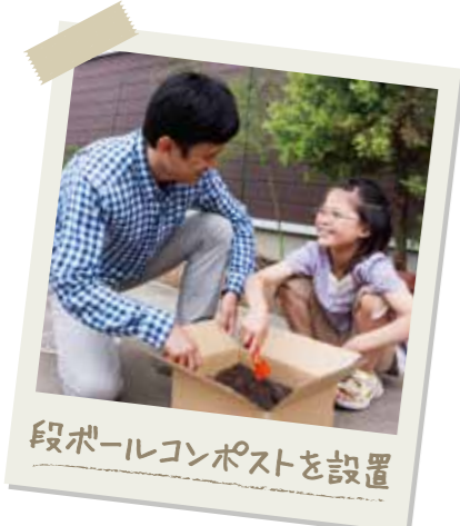
段ボールコンポストを設置