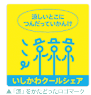
▲「涼」をかたどったロゴマーク

クールシェアスポット となっている百貨店やレ ストランなどの商業施設 では、涼みのスペースを提 供したり、割り引きやドリ ンクサービスを実施した りするなど、さまざまな特