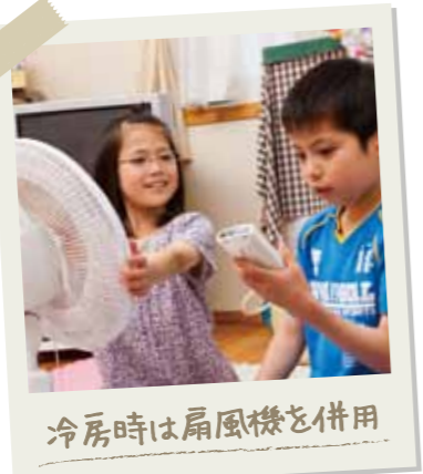
冷房時は扇風機を併用

わが家で実践するエコ活動が決まったら、次はいよいよ「行動」です。9月30日まで家族の皆さんで力を合わせて、選んだエコ活動を実践してみよう。大切なのは、無理のない範囲で取り組むこと。最初から頑張り過ぎると、なかなか続けられませんが、できることからスタートし、エコライフを心がけましょう。