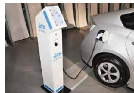
現在、能登半島の25カ所に充電スタンドを設置

電気自動車やプラグインハイブリッドカーの充電スタンドを道の駅や観光スポットなどに設置して、快適でエコなドライブをサポートする「能登スマート・ドライブプロジェクト」では今年、旅をより楽しめる新企画を実施中。その一つが「エコドライブコンテスト」です。これは、トヨタレンタリース石川でプラグインハイブリッドカーを借りた方を対象に、いかにガソリンを使わずに能登をドライブできるかを競うものです。9月までを第1期、10月~11月までを第2期に分け、それぞれでも最もエコな運転をした優勝者には和倉温泉のペア宿