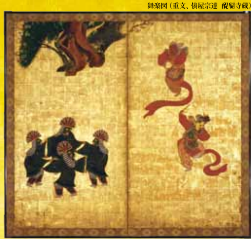
舞楽図(重文、俵屋宗達 醍醐寺蔵)

祖とされる俵屋宗達から俵屋宗雪、喜多川相説、そして深化させた尾形光琳など、近代まで脈々と受け継がれた琳派の系譜を、新たな考察も加えて紹介します。『蓮池水禽図』(国宝、俵屋宗達)や『舞楽図』(重文、俵屋宗達)、『風神雷神図』(重文、尾形光琳)など、装飾芸術の最高峰とされる作品の数々を、この機会にぜひご覧ください。