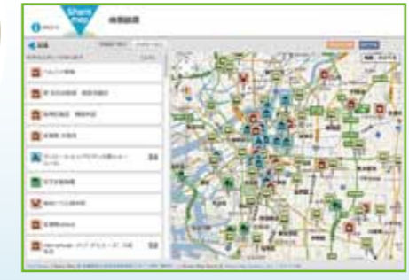
◀◀クールシェアスポットを専用サイトで表示

県では、一目でクールシェ アスポットと分かるよう、 「涼しいところに つんだって いかんけ」をキャッチフレ ーズにロゴマークを作成。 マークをあしらった表示 シールや卓上ミニのぼり、