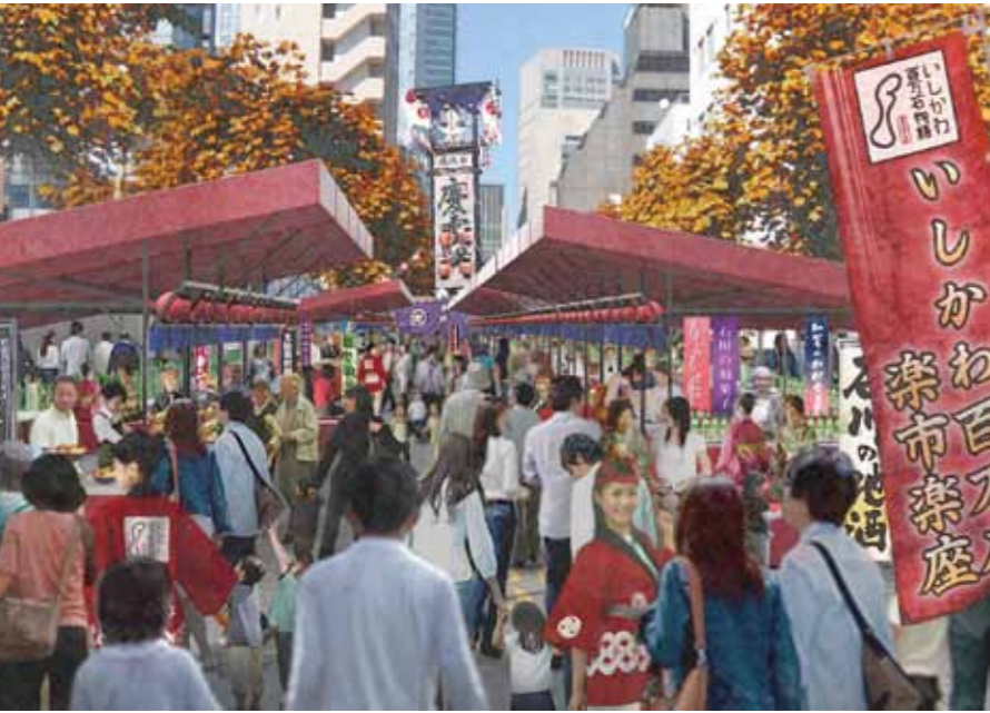
▲ 10月の「日本橋・京橋まつり」にブースを出すなど、魅力発信を本格化