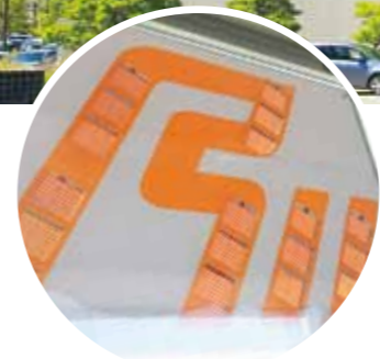
※色素増感太陽電池 (写真・左) さまざまな色で作成でき、形状の自由度も高い太陽電池として期待されています。実用化されれば、壁や窓に設置したり、インテリアに組み込んだりすることができ、従来型に比べて安価に製造できる点も魅力です。