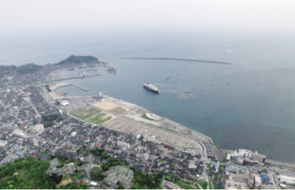
旅客船岸壁の完成で、奥能登地域に陸・海・空の交流基盤が整いました

今年5月の供用式典時には、大型旅客船「いづみ丸」が寄港。輪島港マリンタウンは国土交通省の「みなとオアシス」にも認定されました