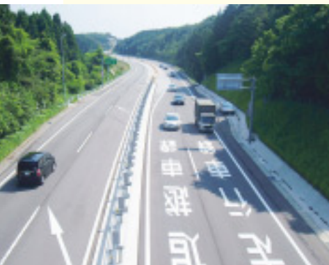
迂回路を生かし、昨年12月に完成した別所岳サービスエリア付近のゆずりレーン

輪島港マリンタウンは輪島朝市や中心市街地にも近く、新たな海の玄関口の誕生をきっかけに、交流人口の拡大や地場産業の振興を期待する声が高まっています。