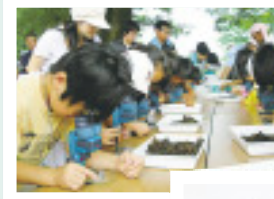
◀土の中の微生物を観察。科学の目で環境を探ります