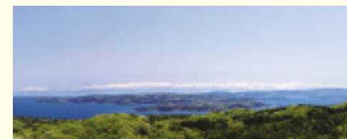
「能登ゆめてらす」からは、美しいパノラマビューが楽しめます

上り線、下り線のどちらのサービスエリアからでも「能登ゆめてらす」に行くことができます。能登有料道路をご利用の際には、ぜひお立ち寄りください。