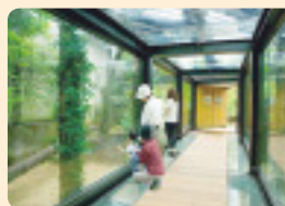
ヒョウ・ピューマ舎は、さまざまな角度から動物の迫力を実感できます