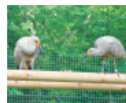
▲繁殖ケージ内の様子

初は、飼育員からエサを与えられていたヒナも現在は巣立ちし、若鳥に。水場にいるドジョウをもちもりと食べていて、体重はわずか3カ月でふ化時の20倍となる12キロを超えています。