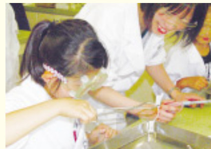
金沢子ども科学財団主催の実験教室の様子。花火を作り、光と物質の色について学びました

対象となる教室は、150講座に上ります。ホームページで公開しているので、ぜひチェックしてみてください。