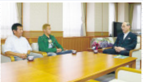
星稜高校サッカー部の河崎護監督とともに来庁されました

本田選手は現在(7月10日)、ロシア・プレミアリーグのCSKAモスクワに所属しています。今後、世界を舞台に、一層の活躍が期待されます。