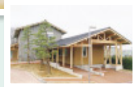
▶エコハウスに関する情報が盛りだくさんです