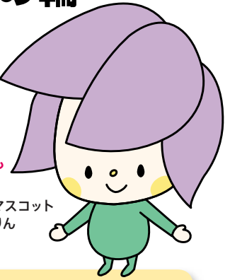
大会マスコット ゆーりん

8日(金) 前日祭・ファッションショー ●午後6:30～午後8:00 ねんりんピック いしかわコレクション2010