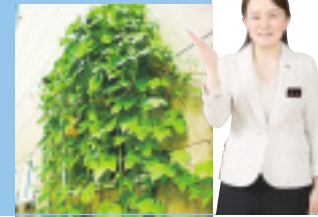
楽しく学べるガーデニングでエコ

窓の外にアサガオやゴーヤなどのツル性植物を覆うように張り巡らせて直射日光を防ぎ、室温の上昇を抑えます。