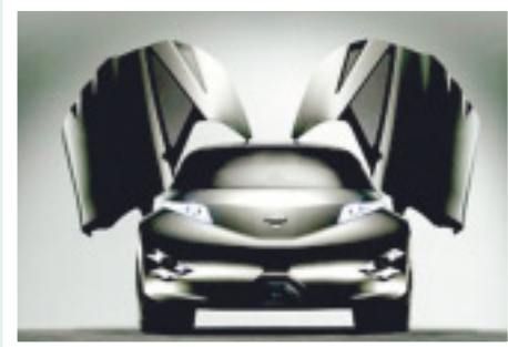
▲電気自動車など数々の環境対応車を展示。試乗もできます