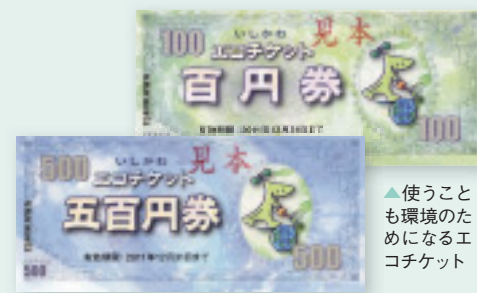
▲使うことも環境のためになるエコチケット

さらに、環境保全活動を通して、県産農林水産物を扱う直売所や、能登井などを提供する飲食店で使えるエコチケットも獲得できます。エコチケットは、石川の森づくりに生かすため、「緑の募金」に寄付することもできます。取り組み期間の10月末までに家庭版環境ISOに登録すれば、どなたでもご参加いただけます。