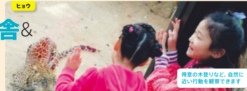
得意の木登りなど、自然に近い行動を観察できます