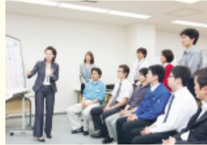
中身の濃い短期集中型のセミナーで、企業のリーダーを育成します

受講生には身につけたスキルを生かし、顧客ニーズをつかんだ積極的な販路開拓を期待しています。10月からは2回目のセミナーを計画中で、現在、受講生を募集しています。