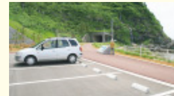
曾々木側には、江戸時代中期に八世乃洞門を開いた麒麟山(きざん)和尚の石像もあります(上) ポケットパークの周辺は、能登の冬の風物詩「波の花」が見られるスポットとしても知られています