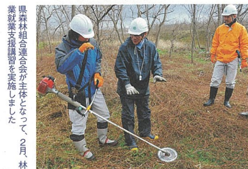
県森林組合連合会が主体となって2月、林業就業支援講習を実施しました

企業での職場実習を通して再就職を支援する「いしかわジョブ・トライアル」制度については、年齢要件を撤廃したのに加え、定員数も21年度は20年度の100人から大幅に拡充し、500人としています。