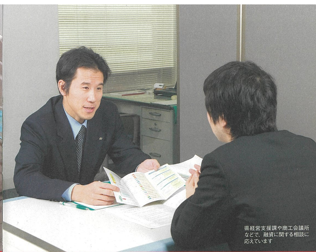
県経営支援課や商工会議所などで、融資に関する相談に応じています