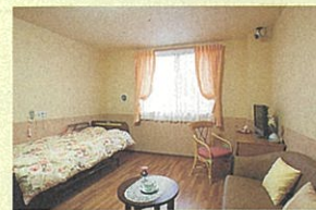
利用者にゆったりとした個室を用意

また、進出先で得たノウハウは、本業にも生かされています。「近年、さまざまな形態の福祉施設を建てる機会が増え、利用者、職員の双方が本場に使いやすい設計を提案できます」と西社長は話し、今後同社では、福祉事業に取り組み建設業者としての強みをより発揮していく考えです。