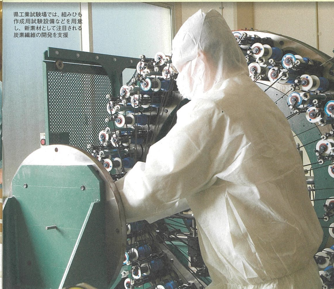
県工業試験場では、組みひも作成用試験設備などを用意し、新素材として注目される炭素繊維の開発を支援