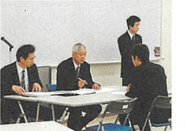
ミニ合同面接会の積極的な開催で再就職を支援

求人数が求職者数を下回る一方、人手不足に悩む業種もあります。そこで、求職者と人材を求める業種を効果的にマッチングするため、21年度はジョブカフェ石川や各ハローワークなどを会場に、月3、4回のペースで緊急ミニ合同面接会を開催します。