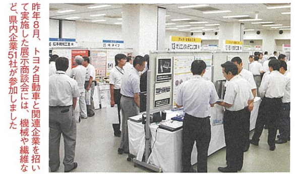
昨年8月、トヨタ自動車と関連企業を招いて実施した展示商談会には、機械や繊維など、県内企業51社が参加しました

さらに、4月には、(財)県産業創出支援機構(ISICO)に緊急販路開拓推進室を設置します。県内企業の実情に精通した受注開拓アドバイザーも2人増員して5人体制とし、県工業試験場の協力も得ながら、メーカー向け技術提案型展示商談会の企画や商機拡大を目指した県内外の企業訪問に一層、力を注ぎます。今秋には、中国・上海の富裕層向けスーパーに、2カ月間の予定で県産商品を販売するトライアルショッ