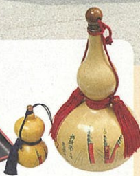
地元グループ手作りのひょうたん 小525円〜