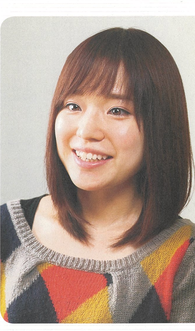
ほっと石川 | インタビュー

一般から募集した詩をもとに、シンガーソングライター川嶋あいさんに作曲をお願いした石川県の子育て応援ソング『ママの手』が完成し、3月、県立音楽堂で披露コンサートが開かれました。曲に込めた想い、歌手への夢を後押しした親子のきずなについて川嶋さんにお話を聞きました。