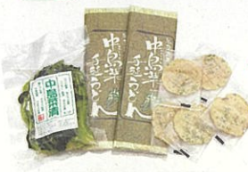
中島菜の加工品(手延べうどん525円ほか)