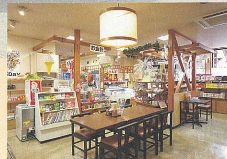
特産品を買ったり、食事を楽しんだりできるスペースが充実