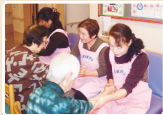
マッサージ中は世間話に花が咲くことも多いそう

春の訪れまで、もうしばらくの辛抱です。とはいえ、例年以上に心が浮き立つのは、やはり北陸新幹線開業まであと1年となったからでしょうか。新幹線で石川を訪れる多くの皆さんと、それを迎える県民の皆さんの笑顔や街のにぎわいが、今から聞こえてくるようです。 今年、東京―新大阪間に新幹線が走ってからちょうど50年になります。当時、私は京都大学の1年生で、所属するサークルの大学間交流で初めて新幹線に乗り、その速さに驚きました。友達と貧乏旅行で乗った夜行列車や鈍行列車も、忘れられない思い出です。 社会人になって、初任地が長崎県でした。飛行機はまだ高根の花の時代。東京から新幹線で大阪まで行き、実家で1泊した後、寝台列車で長崎に向かいました。見知らぬ土地と仕事への不安や緊張でよく眠れませんでした。2年後、今度は別れを惜しみながら東京までの寝台列車に乗りました。夜