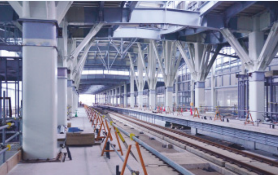
▲整備が進むホーム階