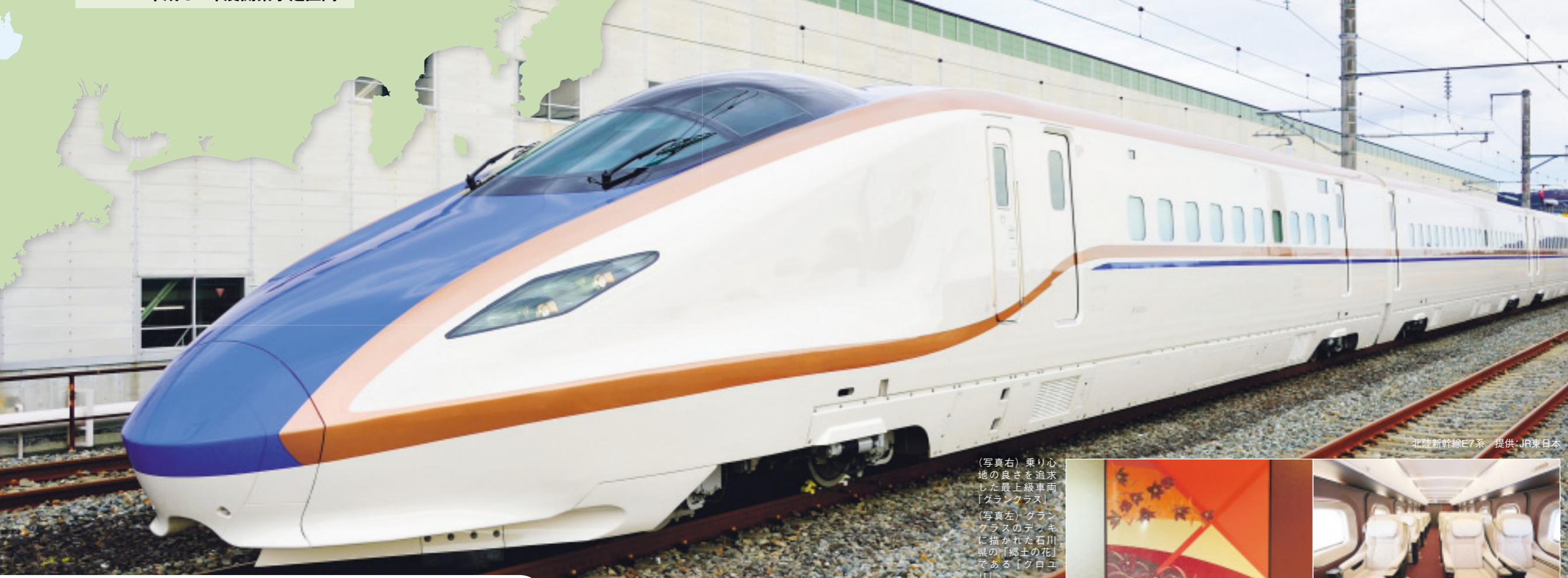
北陸新幹線E7系