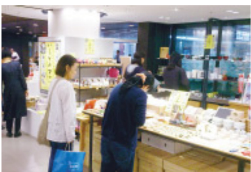
▲いしかわマルシェ(東京駅構内)に並んだ特産品は来店者から大好評

として、山代大田楽や能登のキリコ、加賀鳶はしご登りなどを披露することになっています。さらに、石川のご当地みや特産品の販売ブースを出展するエリアを確保し、石川の食や伝統工芸といった魅力を紹介します。 名だたる老舗が軒を並べる「日本橋」は、歴史と伝統に培われた石川県のブランドイメージに合い、東海道など五街道の起終点でもあります。北陸新幹線のル―