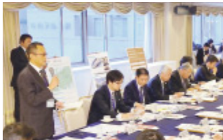
▲(写真上)視察ツアーで実施したレールウォーク ▲(写真下)昨年12月の新幹線部キックオフミーティング

トを活用した情報発信などに取り組むとともに、部員同士が連携した新たな取り組みについても実施していくこととしています。 このほか、県民の皆さんの写真を金沢開業への想いを込めたメッセージとともに発信するウェブ時計「北陸新幹線金沢開業カウントダウン時計」のホームページでの配信なども行っています。