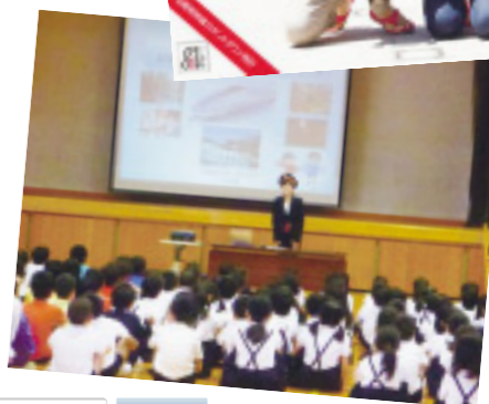
▶(写真上)カウントダウン時計 (写真下)小学校での新幹線講座