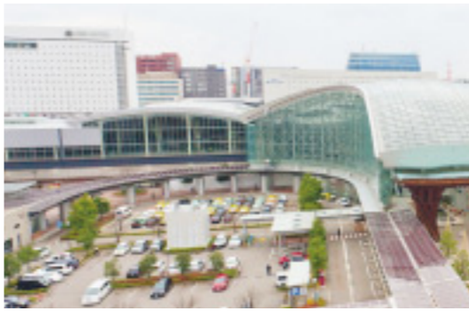
▲もてなしドームと調和のとれた新幹線金沢駅舎

石川の玄関口となる新幹線金沢駅舎の新築工事は、今年9月の完成を目指し、順調に進められています。1階に改札口と駅事務室、中2階に在来線との乗り換え改札口と待合室などが設置され、ホーム階には長さ312メートルのプラットフォーム2面と線路4本の新幹線ホームが整備される予定です。