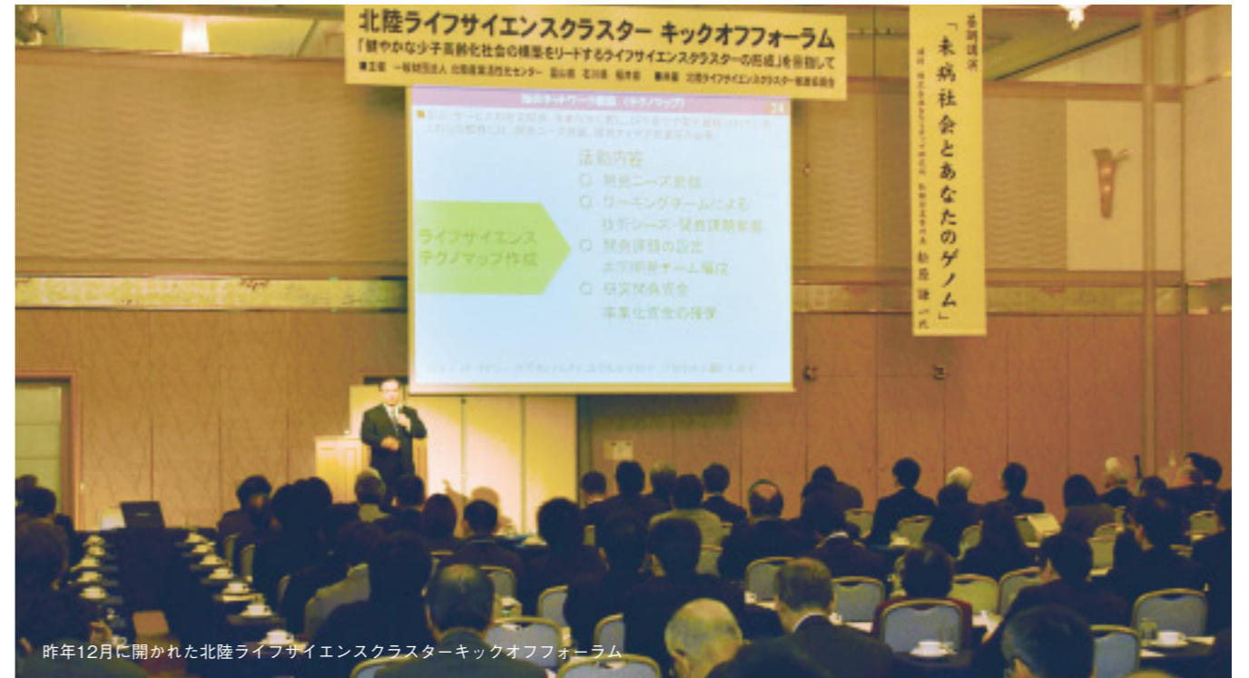
昨年12月に開かれた北陸ライフサイエンスクラスターキックオフフォーラム