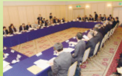
▲第1回北陸産業競争力協議会

あり、地方の技術に光を当て、世界をにらんで国と地方で産業力の強化に取り組むことは、北陸地域の産業の発展だけでなく、わが国全体の発展にもつながることから、この協議会を通じて、これを強力に推進することが必要と考えています。