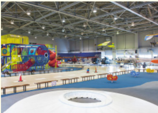
▼雨や雪の日も遊べる「ぶーんぶんワールド」